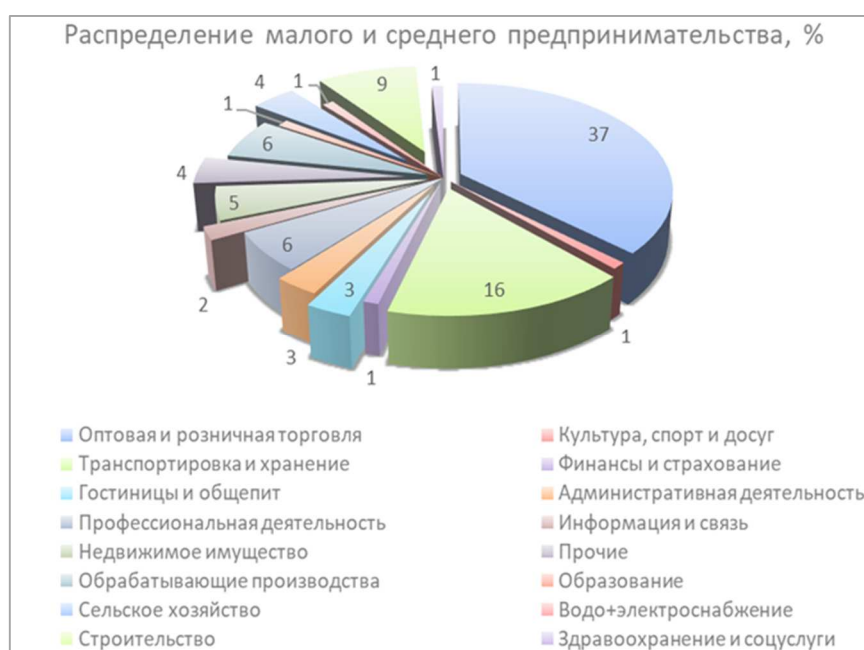
Рисунок 2. – Распределение МСП по видам экономической деятельности в Липецкой области

Согласно данным Правительства Липецкой области сферы деятельности МСП распределены следующим образом: