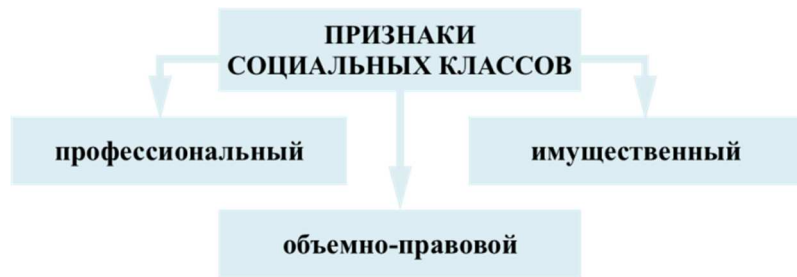
Рисунок 1. – Признаки социальных классов