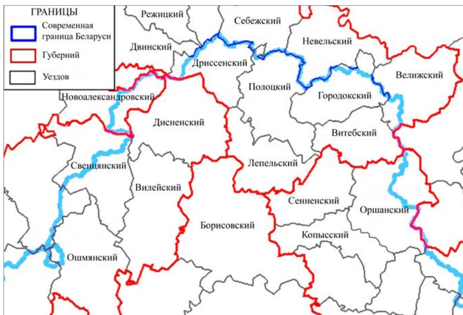
Рис. 1. Административно-территориальное деление северной части Беларуси в середине XIX в. Карта-схема составлена В. Е. Овсейчиком