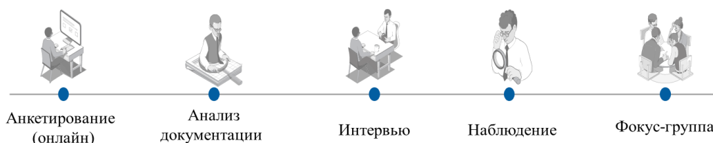
Рисунок 2. – Методы, используемые для проведения независимой оценки состояния культуры безопасности

Методы, используемые для проведения независимой оценки состояния культуры безопасности, приведены на рисунке 2.