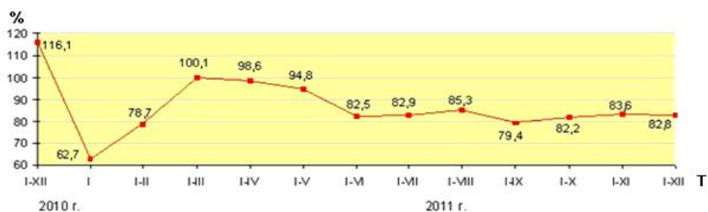
Рис. 1. Динамика ввода в действие жилья, % к соответствующему периоду предыдущего года

Однако в 2011 году прогнозируемые темпы роста жилищного строительства не были обеспечены. Организаниями всех форм собственности в 2011 году построено 68,3 тыс. новых квартир (в 2010 году – 84,7 тыс.). Введено в эксплуатацию 5 487 тыс. кв. м общей площади жилья, что составляет 73,2 % к предусмотренному заданию на год. По сравнению с 2010 годом ввод в действие жилья уменьшился на 1 142,9 тыс. кв. м, или на 17,2 % [1]. Динамика ввода жилья в действие представлена на рисунке 1.