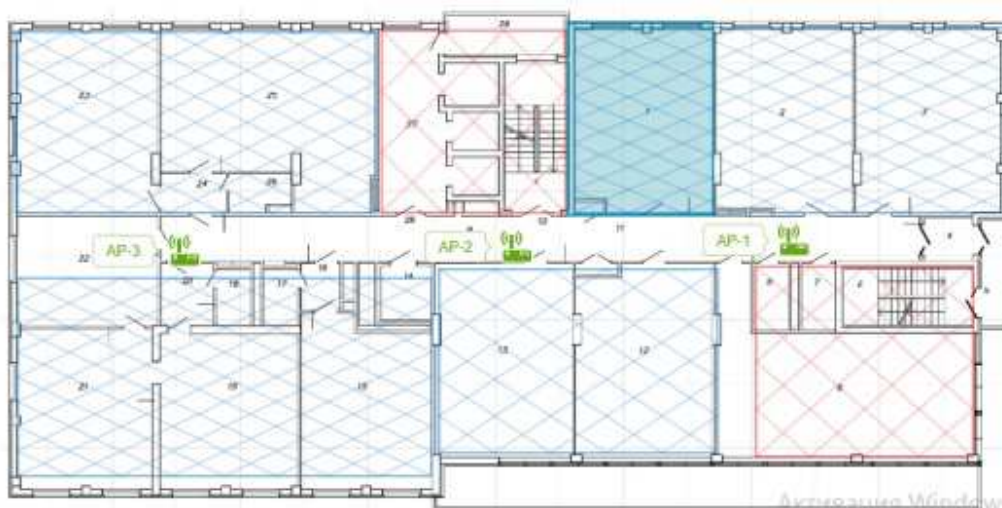
Рисунок 1. – Размещение точек доступа

Для разработки схемы организации сети необходимо учитывать особенности распространения радиосигнала внутри помещения, где кроме стен из различных конструкционных материалов, существует большое количество объектов, которые будут препятствовать прохождению сигналов. Кроме того на распространение сигнала оказывает влияние явление дифракции, возникающее когда путь распространения сигнала между передатчиком и приемником затруднен поверхностью с резкими неровностями (краями). Что при организации рабочих мест с использованием оборудования работающего в диапазоне 5 ГГц, что при работе на высокой скорости, необходимо уменьшить количество препятствий и расстояние на линии передатчик-приемник до приемлемого. Это возможно достичь путем увеличения в помещениях количества точек доступа. Программа D-Link Wi-Fi Planner Pro предназначена для первичного анализа плана помещения с целью размещения на нем точек доступа Wi-Fi. Программа ориентирована на использование оборудования D-Link[4]. Вариант размещения точек доступа на этаже представлен на рисунке 1.