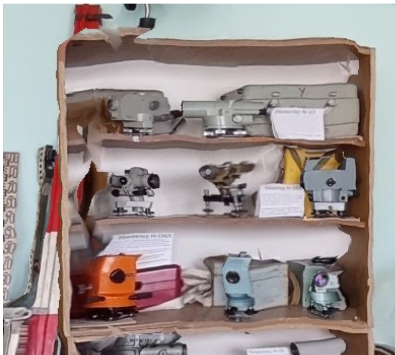
Рисунок 2. – Фрагмент тайловой модели (шкаф с приборами)

В результате проведенного анализа съемки мы пришли к выводу, что для достижения более качественных и точных результатов необходимо учитывать множество факторов, влияющих на итоговое изображение. Основные проблемы, такие как неровности и несовпадения в фокусировке, можно устранить, изменив сценарий съемки и подход к освещению. Важно использовать различные точки съемки и уровни, а также применять дополнительные меры, такие как использование штатива и улучшение условий освещения. Применение этих рекомендаций позволит значительно повысить качество фотографий и избежать подобных недостатков в будущем. Вследствие этого повысится качество получаемой модели, которая будет пригодна для дальнейшего использования, к примеру создания виртуального тура по музею.