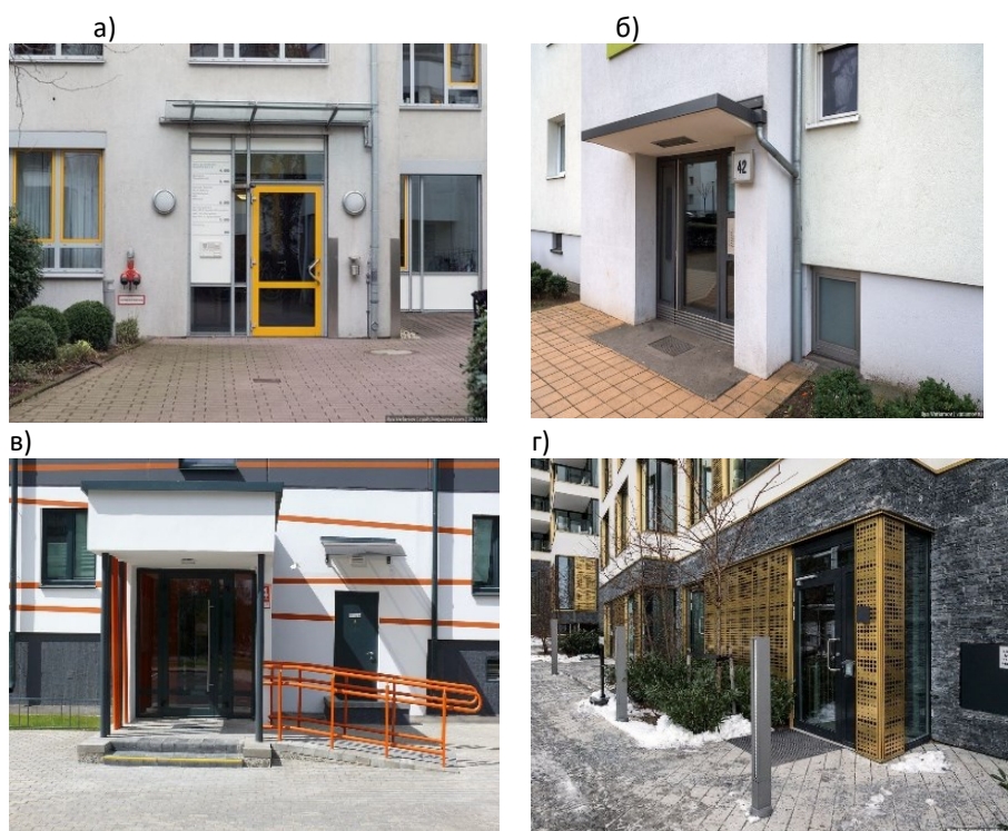
а) г. Берлин, Германия, б) г. Варшава, Польша, в) г. Москва, Россия и г) г. Осло, Норвегия

При анализе было выявлено, что во всех странах уделяется большое внимание доступности входных групп для людей с ограниченными возможностями и действуют законы и нормативы, которые обязывают застройщиков и владельцев зданий обеспечивать доступность входных групп. Это включает в себя установку пандусов, лифтов, подъёмников и других специальных устройств, а также тактильных указателей и информационных систем (рисунок 3). Но при этом можно встретить входные группы, которые были построены довольно давно без элементов, которые обеспечивают удобство.