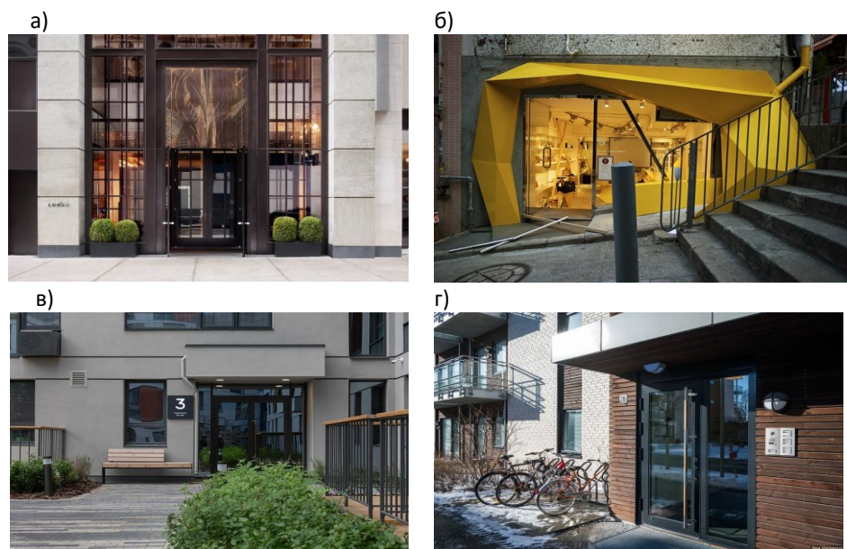
а) входная группа в г. Кельн, Германия, б) входная группа в г. Познань, Польша, в) входная группа в г. Санкт-Петербург, Россия, г) входная группа в г. Осло, Норвегии Рисунок 1. – Входные группы, с отличительными элементами в соответствии с климатом

Безопасность и функциональность Входная группа является важным элементом любого здания или сооружения, поэтому её безопасность и функциональность играют ключевую роль в формировании общего впечатления и удовлетворенности пользователей.