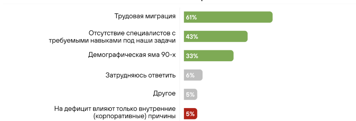
Рисунок 2. – Внешние причины влияния на нехватку кадров [5]

В числе наиболее популярных внутренних факторов (по мнению самих работодателей) оказались неконкурентные заработные платы, тяжелые или непривлекательные условия труда, а также завышенные требования к кандидатам внутри компании [5].