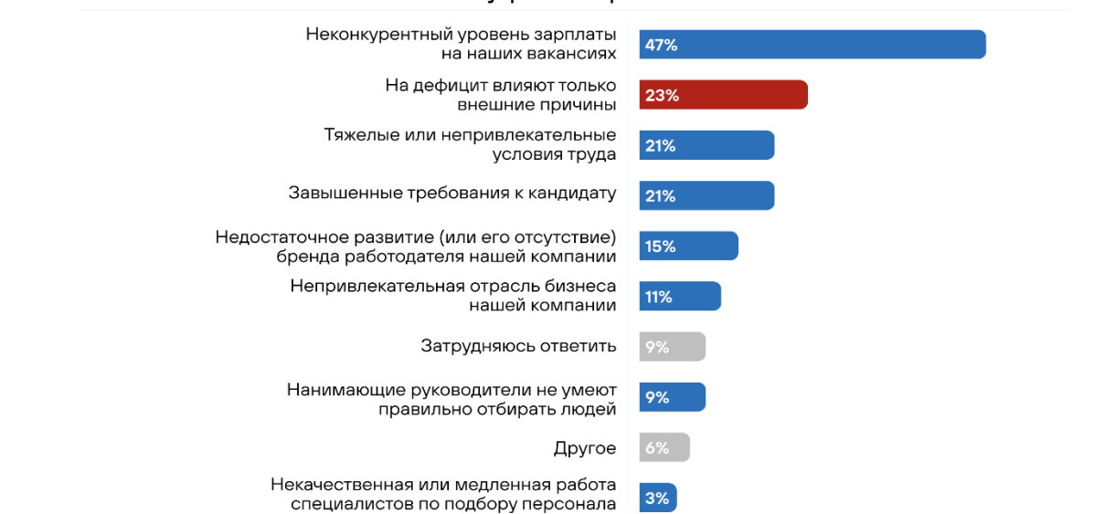
Рисунок 3. – Внутренние причины на нехватку кадров [5]

Внедрение современных цифровых инструментов значительно повышает качество обслуживания. Благодаря этому клиенты могут решать любые проблемы удаленно, экономя время и силы. Использование