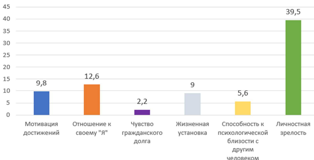
Рисунок 2 – Диаграмма средних значений по методике «Тест-опросник личностной зрелости» Ю. З. Гильбуха

На третьем этапе исследования был проведен корреляционный анализ переменных личностной зрелости и межличностной зависимости. Для определения взаимосвязи показателя «Эмоциональная опора на других» и показателей «Мотивация достижений», «Отношение к своему Я», «Жизненная установка» и «Личностная зрелость» использовался коэффициент ранговой корреляции Спирмена с использованием программы STATISTICA 8. Коэффициент рангов Спирмена позволяет определить тесноту (силу) и направление корреляционной связи между двумя признаками. Полученные результаты исследования представлены в таблице 1.