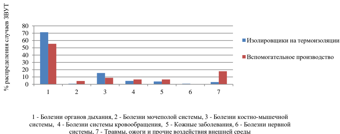
Рисунок 1. – Процент распределения случаев ЗВУТ по отдельным нозологическим формам

Важным является не только анализ обобщенных показателей ЗВУТ, но и трудовые потери по отдельным нозологическим формам. Распределение числа случаев ЗВУТ и дней временной нетрудоспособности по отдельным нозологическим формам в исследуемых группах представлены на рисунках 1 и 2 соответственно.