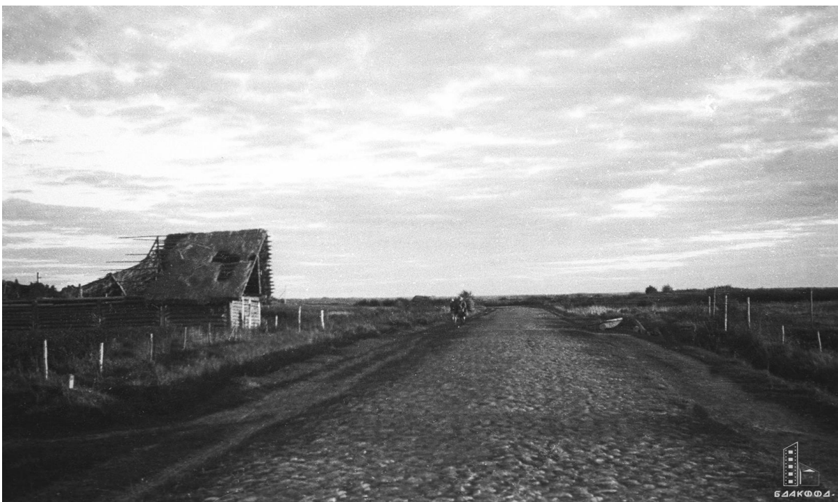
Фота 2 – «Від на в. Задзежжа Асвейскага р-на Полацкай вобл., спаленую нямецка-фашысцкімі акупантамі ў перыяд Вялікай Айчыннай Вайны». 1946 г.