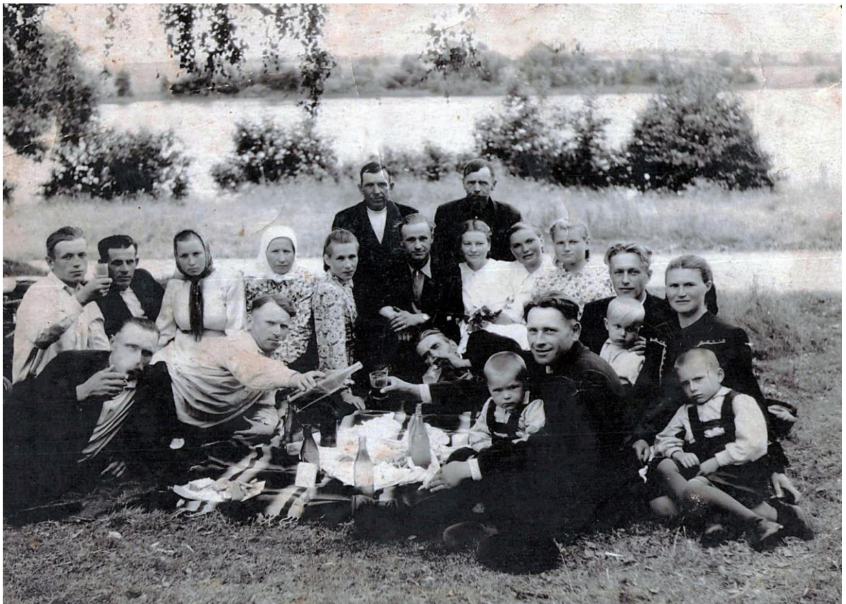
Фота 14 – “На Петрачка” ў Чэрасах Мёрскага р-на. 1956 г.