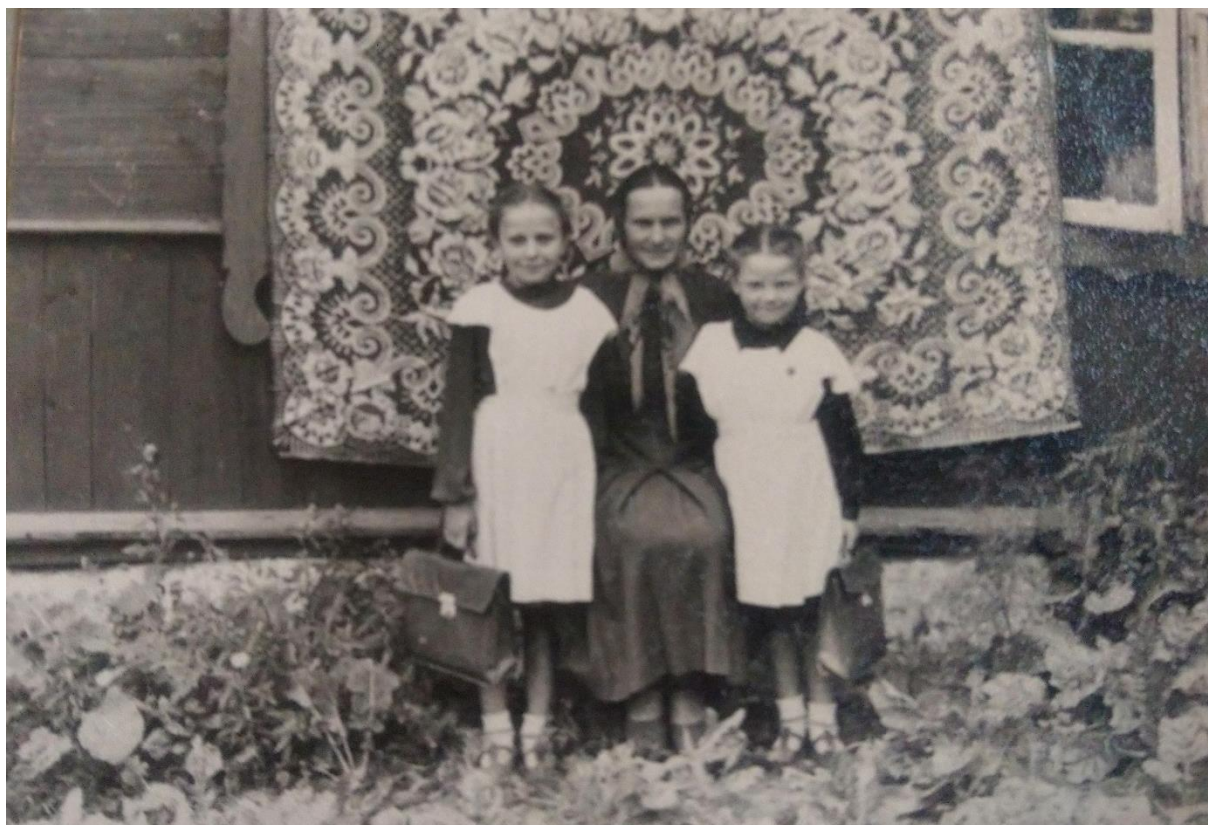
Фота 6 – Бабуля з унучкамі. Сярэдзіна 1950-х гг. Фотаархіў Дзісенскай фальклорна-этнаграфічнай экспедыцыі 2019 г., з асабістага архіва Ляснічай Л.Г., г. Дзісна