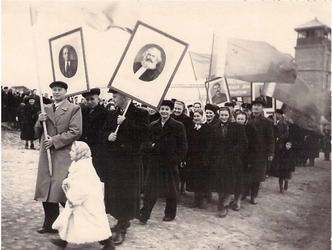
Фота 3 – Святочная дэманстрацыя ў Дзісне. 1957 г.