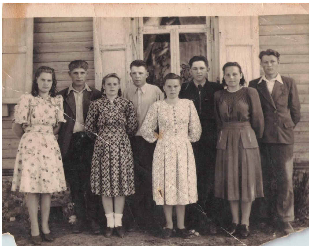
Фота 26 – Моладзь каля хаты. 1949 г.