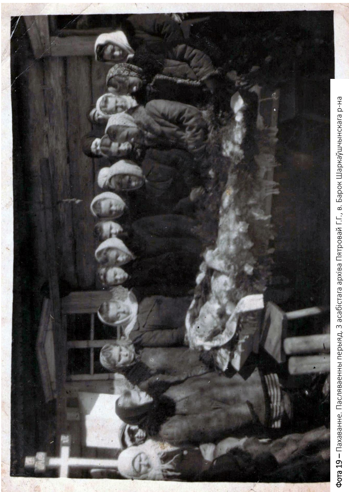
Фота 19 – Пахаванне. Пасляваенны перыяд.