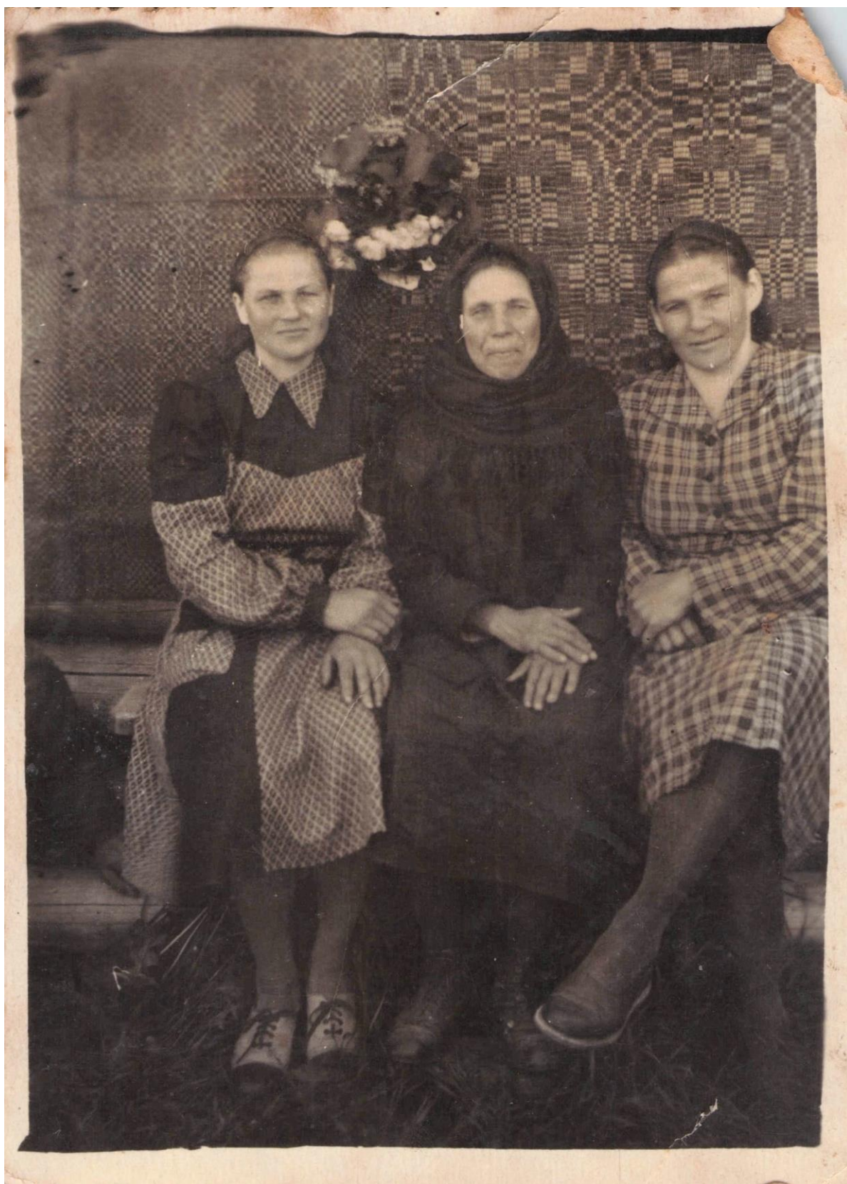
Фота 11 – Дзяўчаты з бабуляй. 1955 г.