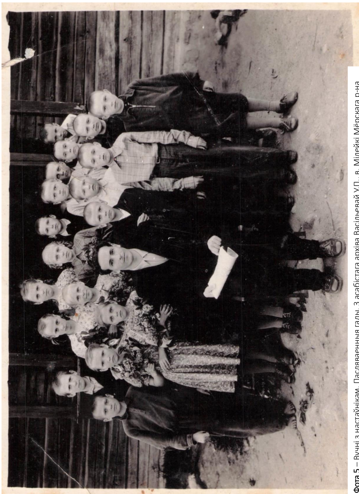
Фота 5 – Вучні з настаўнікам. Пасляваенныя гады. З асабістага архіва Васільевай У.П., в. Мілейкі Мёрскага р-на