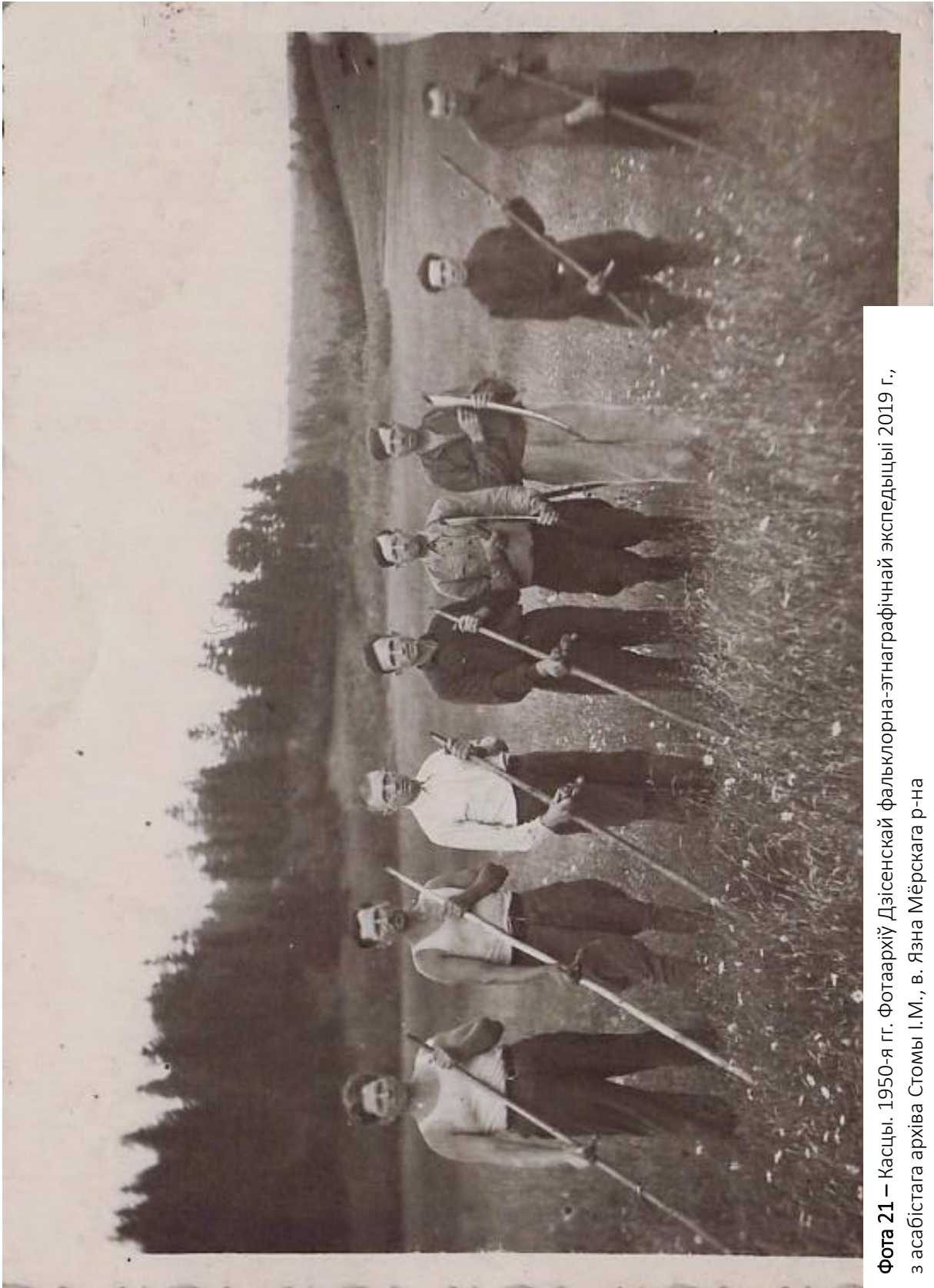
Фота 21 – Касцы. 1950-я гг. Фотаархіў Дзісенскай фальклорна-этнаграфічнай экспедыцыі 2019 г., з асабістага архіва Стомы І.М., в. Язна Мёрскага р-на