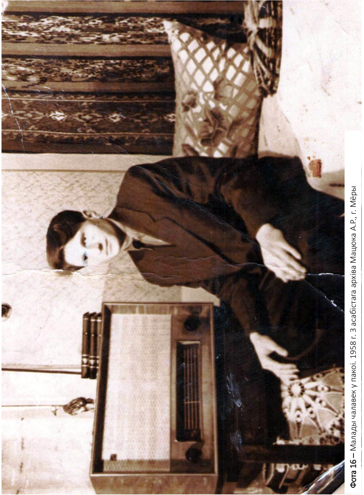
Фота 16 – Малады чалавек у пакоі. 1958 г. З асабістага архіва Мацюка А.Р., г. Мёры