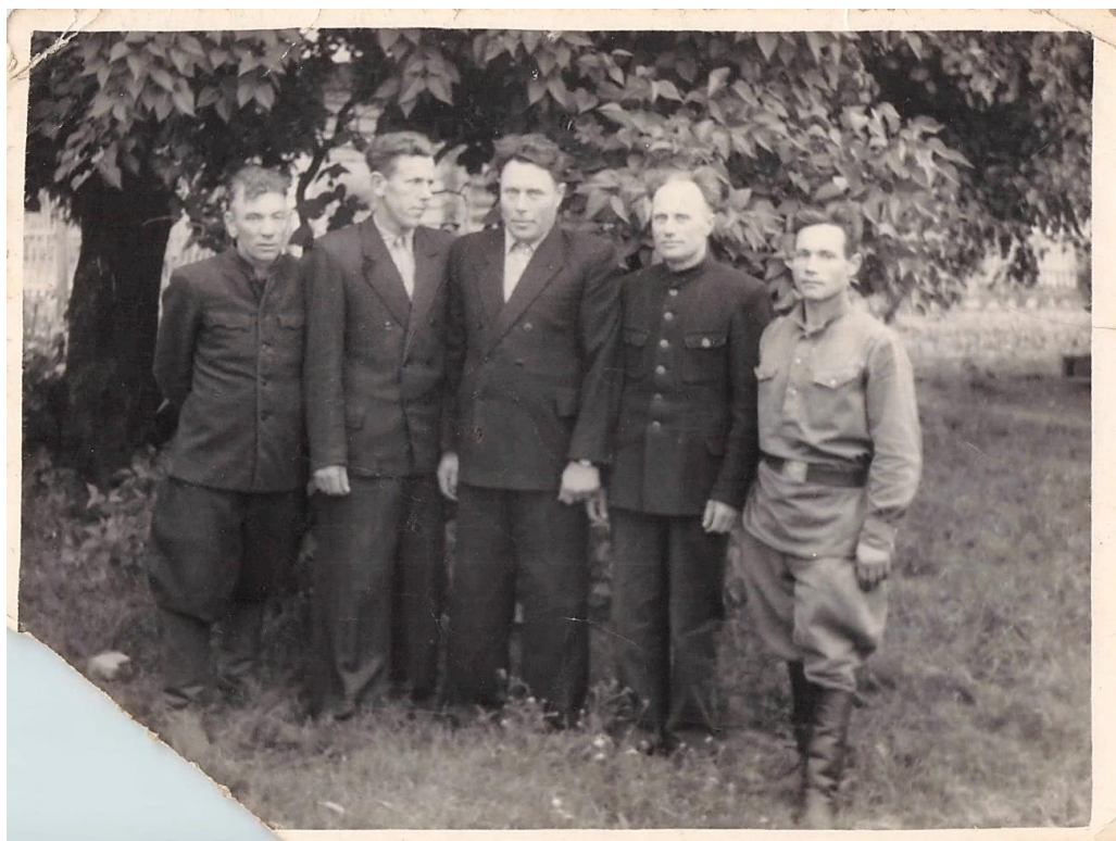
Фота 25 – Мужчыны на прыродзе. Пасляваенныя гады. З асабістага архіва Пятровай Г.Г., в. Барок Шаркаўшчынскага р-на