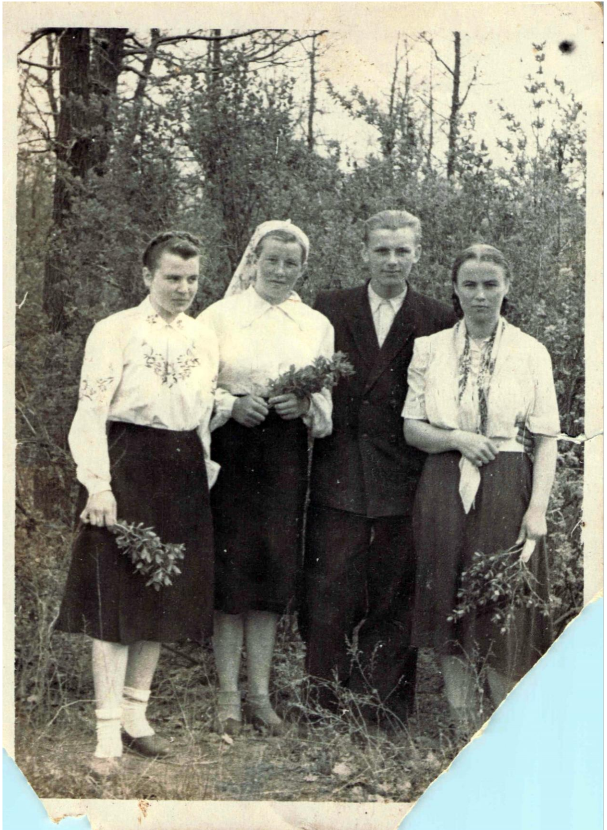
Фота 9 – Кампанія на прыродзе. 1956 г.