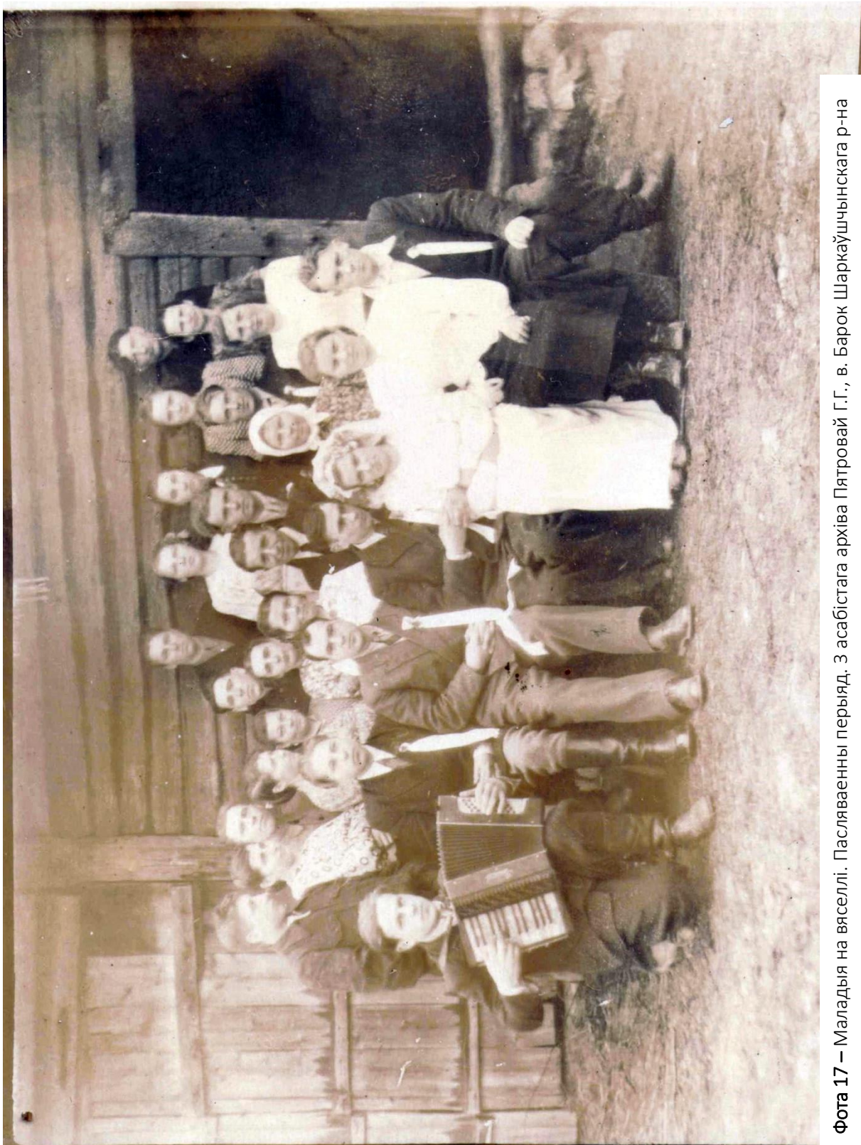
Фота 17 – Маладцыя на вяселлі. Пасляваенны перыяд.