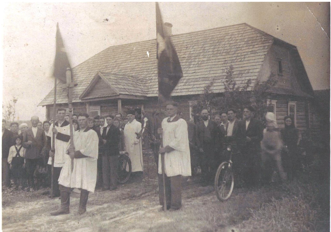
Фота 4 – Пахавальная працэсія. Пасляваенныя гады. З асабістага архіва Пятровай Г.Г., в. Барок Шаркаўшчынскага р-на