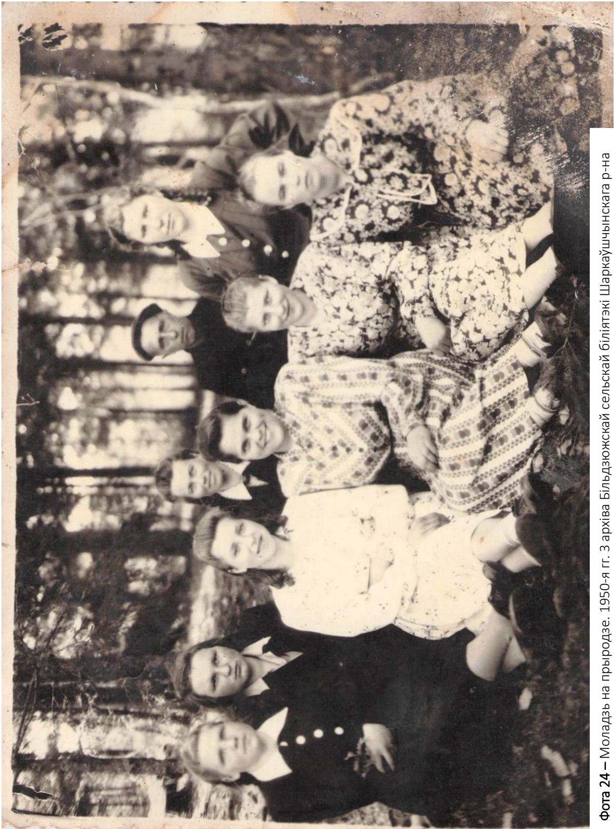
Фота 24 – Моладзь на прыродзе. 1950-я гг.