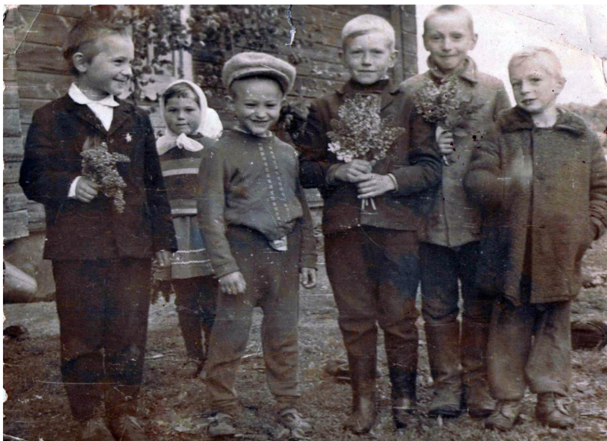
Фота 7 – Дзеці на вуліцы.