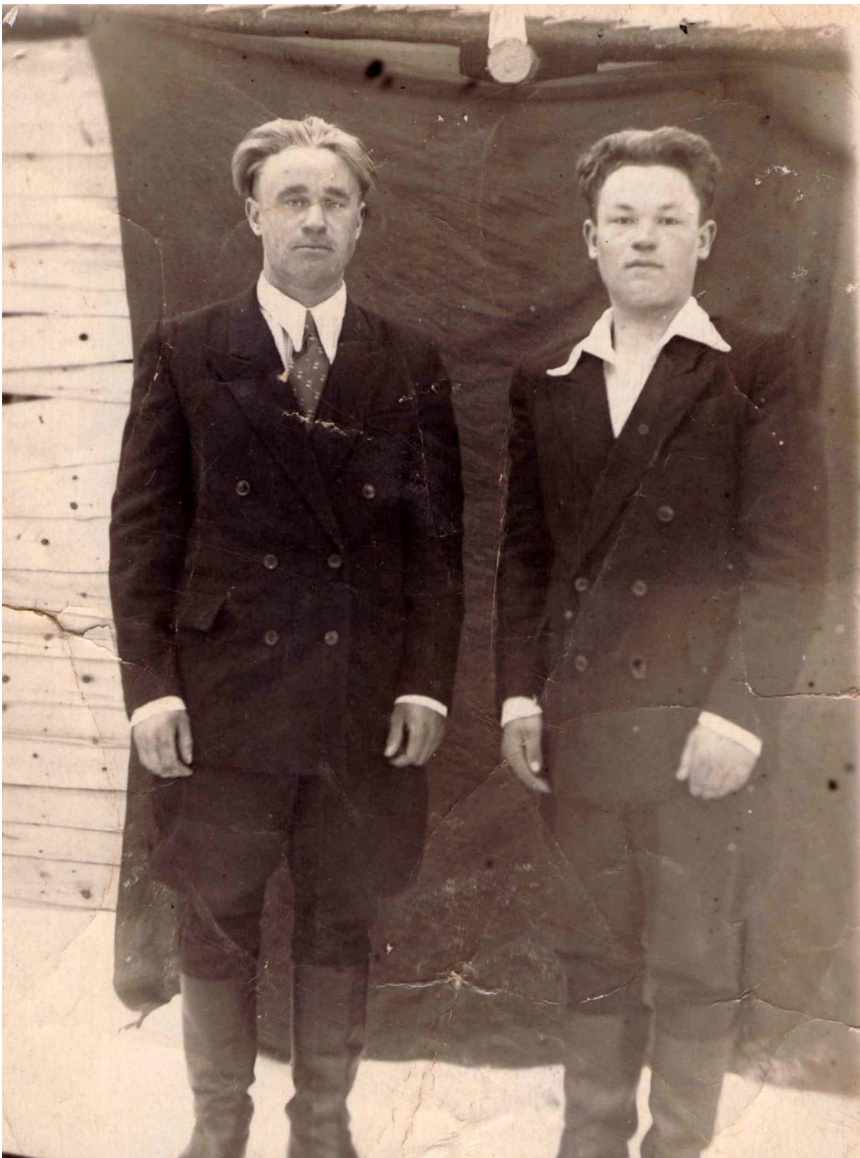
Фота 8 – Мужчыны.