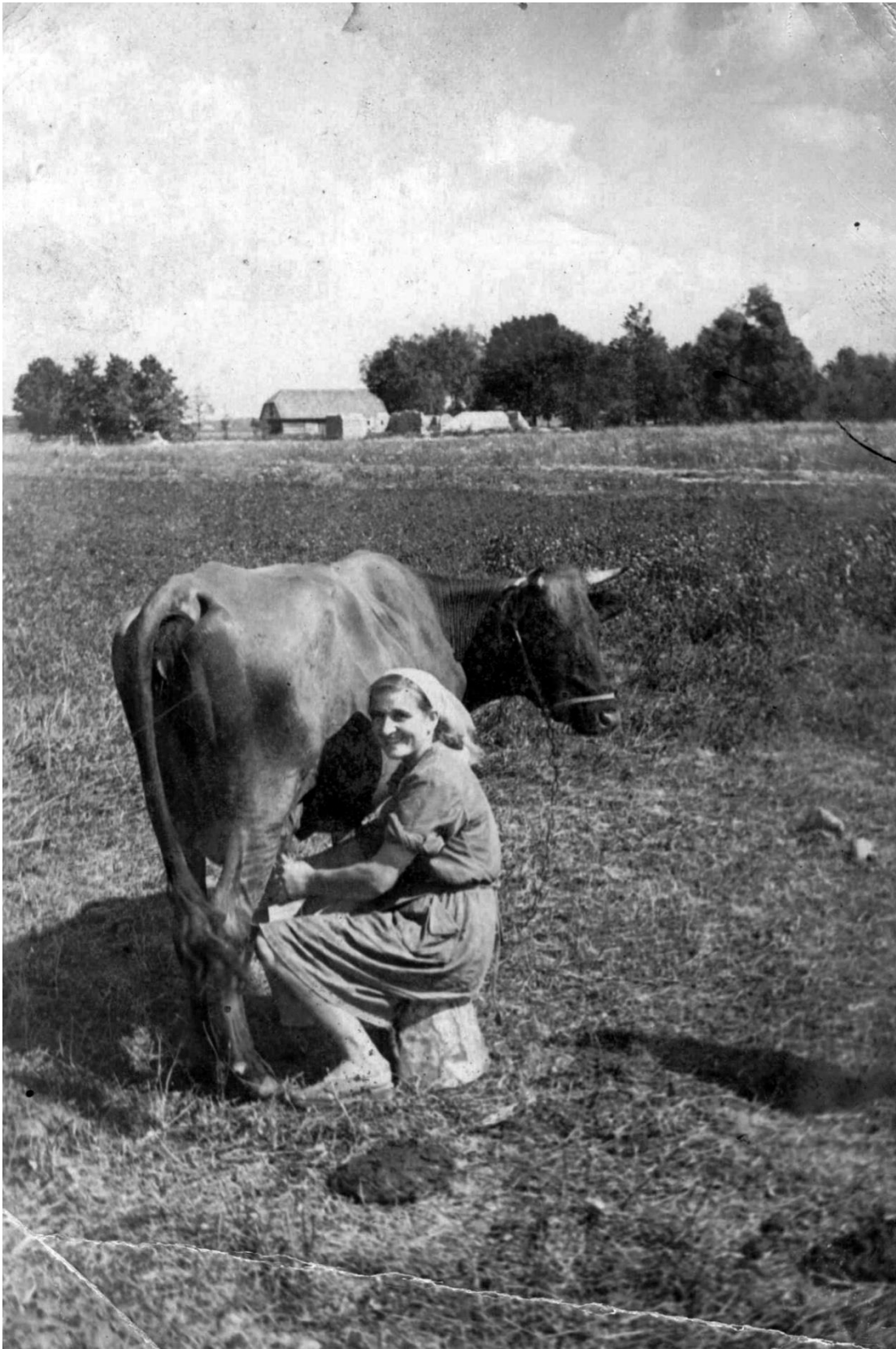
Фота 12 – Жанчына доіць карову. 1950-я гг.