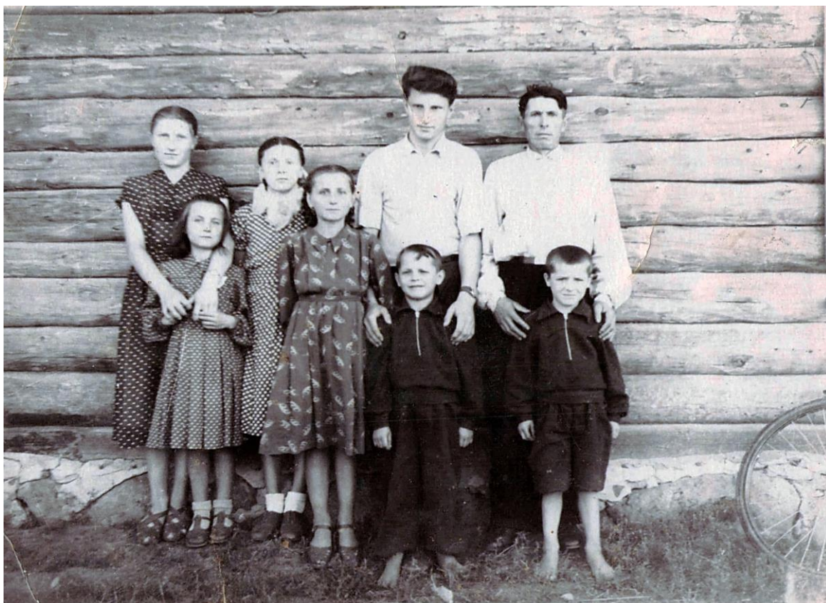
Фота 22 – Сям’я каля хаты. Пасляваенны перыяд.