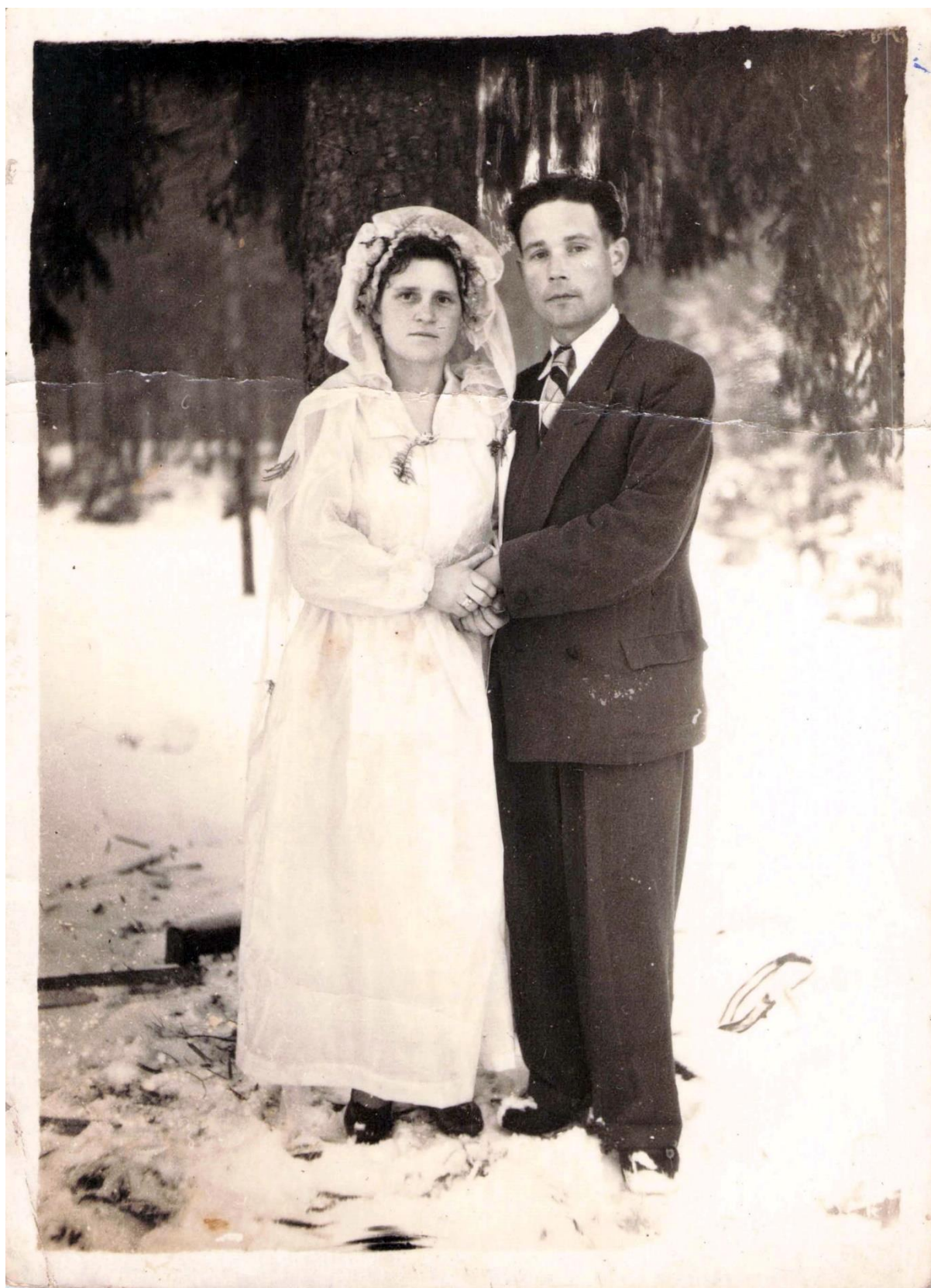
Фота 18 – Маладыя на вяселлі. Пасляваенны перыяд.