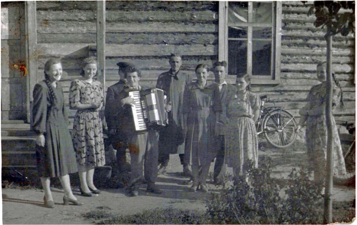
Фота 13 – На танцах. Пасляваенны перыяд.