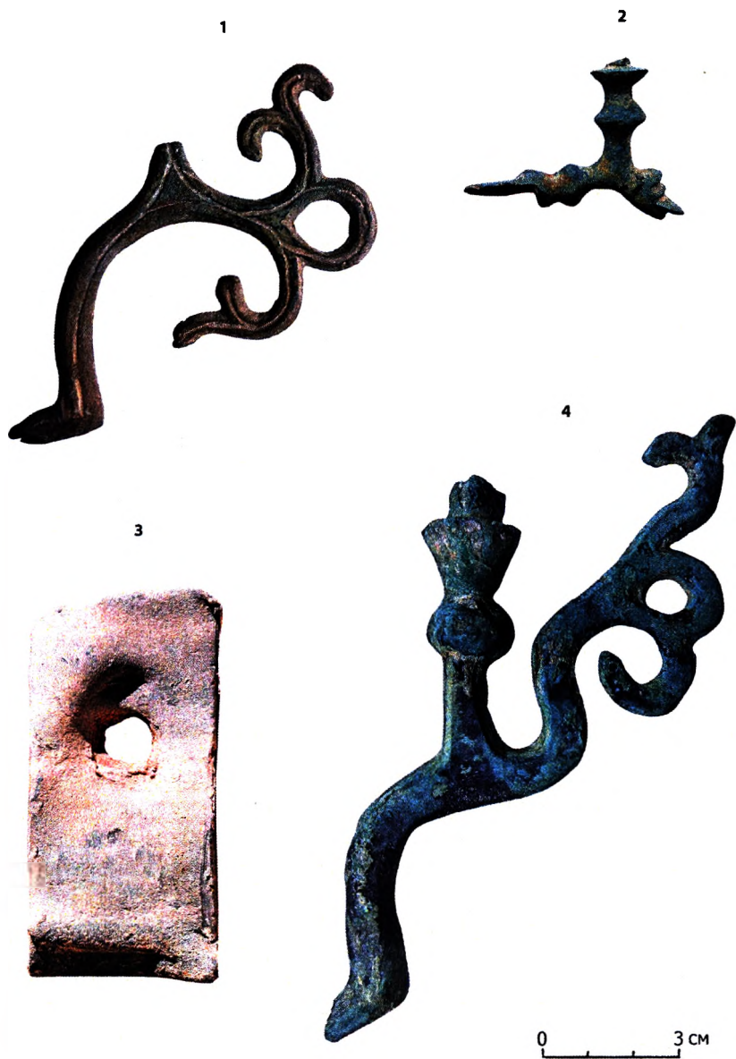
Мал. 2. Вырабы з каляровых металаў з даследаванняў 2015—2019 гг. на тэрыторыі Спаса-Праабражэнскага храма 1—2, 4 — фрагменты хорасаў, 3 — фрагмент пакрыцця даху