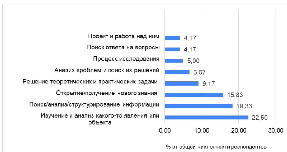
Рисунок 1. – Наиболее популярные представления студентов об исследовательской деятельности, в %

На рисунках 1 и 2 представлены ответы студентов на вопросы «Исследовательская деятельность это – ...», «Какие методы исследования (научного исследования) Вы знаете или использовали в учебной, научной, профессиональной деятельности?».