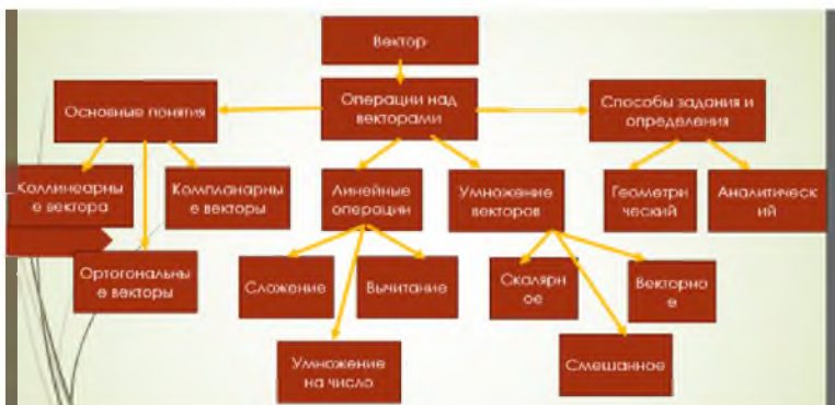
Рис. 2. «Графическая схема модуля «Элементы векторной алгебры», составленная студентом»