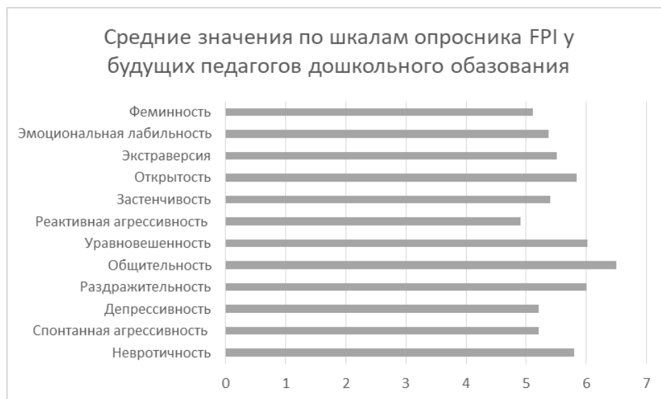
Рис. 1. Диаграмма средних значений по шкалам опросника FPI у студентов специальности «Дошкольное образование»

На первом этапе исследования были измерены личностные качества у студентов, обучающихся по специальности «Дошкольное образование» ( n = 45 , возраст: 17–18 лет, в основном 1 курс), были получены следующие результаты, представленные на рисунке 1.