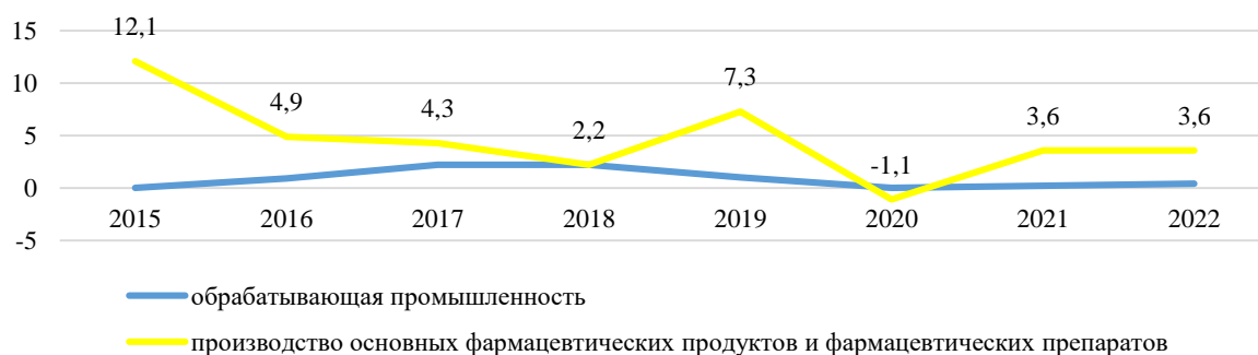
Рисунок 2. – Уровень ежегодного прироста организаций, в процентных пунктах