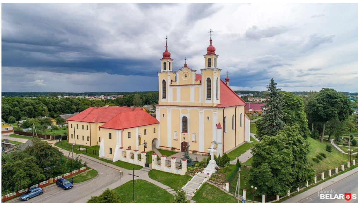
Рис. 2. Церковь Святых Петра и Павла [2]