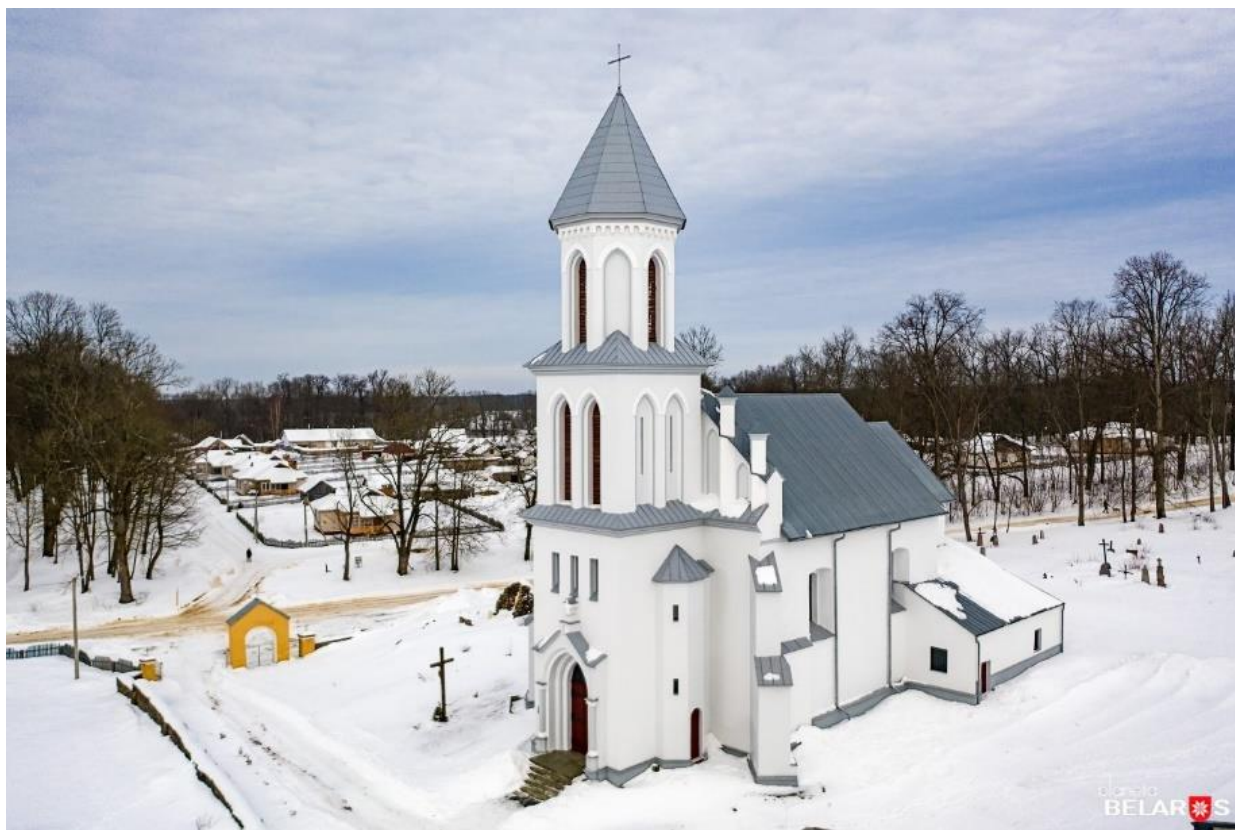
Рис. 5. Церковь Святого Казимира [6]

Проект разработки туристического маршрута на сегодняшний день находится в стадии разработки. Со временем в проект добавятся не менее запоминающие памятники архитектуры, и карта расширится. Нашей основной и самой главной целью является акцентирование внимания на уникальность белорусского зодчества на примере данного маршрута и привлечение внимания к архитектуре и истории Беларуси.