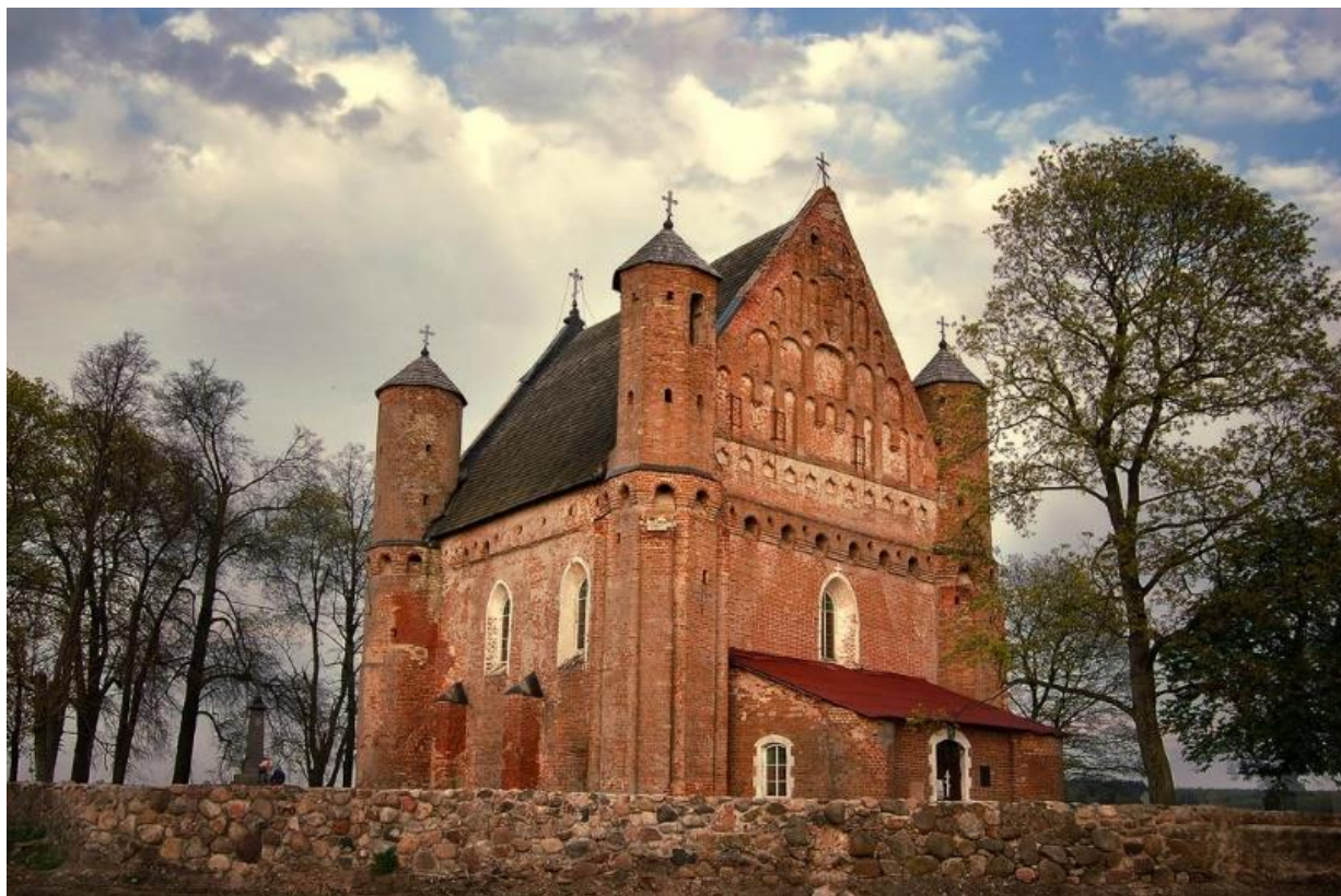
Рис. 4. Храм святого Архангела Михаила [5]

1576 г. костел по предписанию Николая Радзивилла Черного был превращен в кальвинистский сбор и пробыл им более полусотни лет. В 1642 г. католики снова обрели свой костел. Внешний облик костела Святого Казимира весьма аскетичен: продолговатые, присущие готике, линии, стрельчатые окна. Единственные украшения — лепнина на капителях полуколонн да узорная ковка на двери. Кстати, красивая башня-звонница, делающая святыню такой узнаваемой, была пристроена только в конце XIX в. А уже в XX столетии костел силились погубить. Одни полагают, что не обошлось без воинствующих безбожников, иные верят, что пожар 1986 г. произошел сам по себе. Некоторое время древний храм стоял в запустении и был отреставрирован лишь в 1991 г. [6].