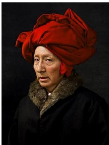
Рис. 4. Ясумаса Моримура. История искусства в автопортретах. Ван Эйк в красном тюрбане. 2016 год [4]

Один из самых значимых японских художников современности Ясумаса Моримура работает в жанре апроприации, (присвоения). Он известен тем, что заимствует какой-либо знаковый образ из истории искусства и «примеряет» его на себя, воссоздавая их со своим лицом и телом. Он использует обширный реквизит, костюмы, макияж и цифровые инструменты, чтобы изобразить себя в виде знаменитых персонажей западной культуры, а также известных фигур послевоенной Японии (рис. 4). Его сатирические автопортреты исследуют темы расы, сексуальности и пола, бросая вызов восприятию азиатской мужской идентичности.