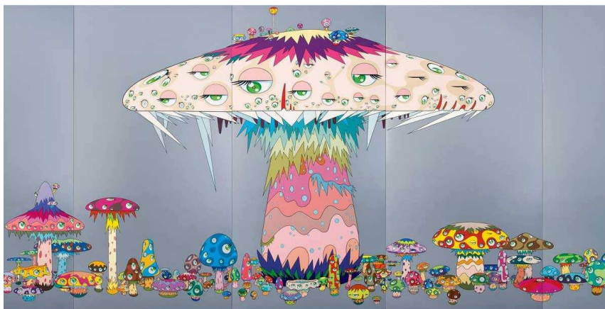
Рис. 2. Такаши Мураками «Супернова» 1999 год [2]

Еще одним типичным представителем, чье творчество несет в себе отпечаток культуры кawaii, является Такаши Мураками. Он обращается в своих работах не только к современной культуре манга и аниме, но и к более старым стилистическим направлениям, и, в целом, к генеалогии японского искусства. В работах Мураками присутствуют черты его личных и часто провокационных интерпретаций «эксцентричных» художников периода Эдо, чьи работы стали неотъемлемой частью японского изобразительного искусства. Выполненная в фирменном стиле Мураками Superflat и сочетающая традиционную японскую живопись с современной поп-культурой, его работа под названием «Supernova» на первый взгляд кажется изображением радостной детской мечты (рис. 2). Однако калейдоскопические оттенки и деформированные формы вызывают зловещие ассоциации с атомным грибом, и таким образом художник подвергает критике все, что относится к оружию массового поражения и военным конфликтам.