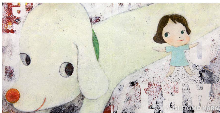
Рис. 1. Ёситому Нара, иллюстрация к книжке с картинками "Tomodachi ga Shitashita Koinu" 1999 год [1]

Одним из ярких представителей современного японского искусства, в чьем творчестве стилистика аниме и кawaii прослеживается особенно красноречиво, является токийский художник Ёситомо Нара. Он известен своими картинами детей и животных, которые кажутся одновременно невинными и угрожающими. Его персонажи часто держат в руках оружие, такое как ножи или пилы. Однако они никогда не предназначались для агрессии (рис. 1).