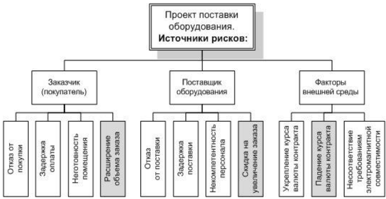
Рисунок 3. – Пример дерева рисков проекта

Б. Необходимо провести идентификацию выделенных в матрице рисков по источникам их возникновения (покупатели, поставщики, внешняя среда и т.д.) и построить «дерево рисков» (рисунок 3).