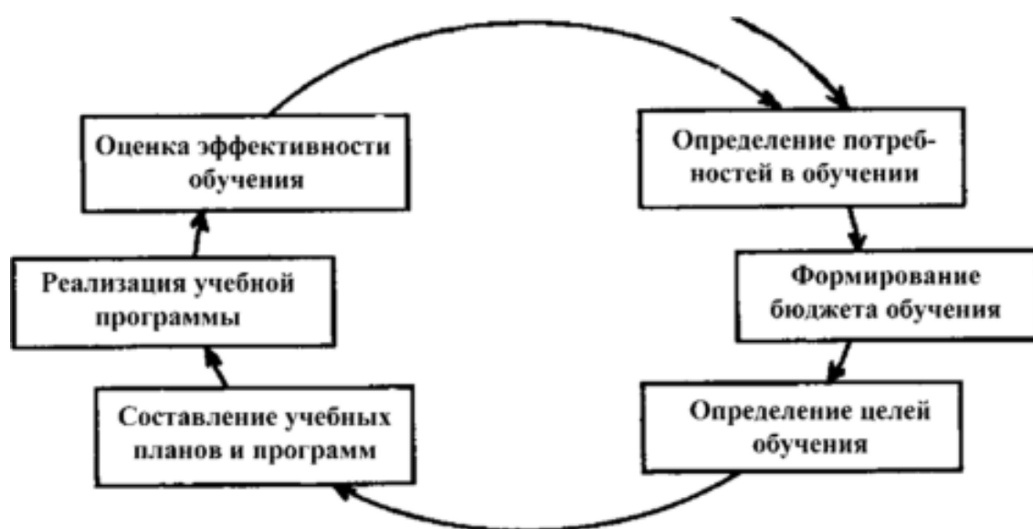
Рисунок 1. – Модель систематического профессионального обучения персонала

В современных организациях профессиональное обучение представляет собой непрерывный процесс. Для организации процесса обучения специалисты используют модель систематического профессионального обучения персонала (рисунок 1).