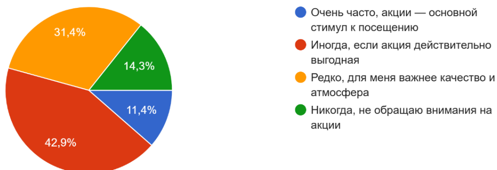
Рисунок 4. – Влияние акций на выбор заведения общественного питания

Влияние «эффекта стадности». Пятый вопрос подтвердил важность социальной значимости заведения. Для 40 % респондентов популярность места в их круге общения скорее важна, но не является главным критерием. А для 20 % - популярность очень важна. Это означает, что посещение «трендовых» мест является для молодежи способом социальной идентификации и поддержания связей в группе, что соответствует принципам социологической модели поведения.