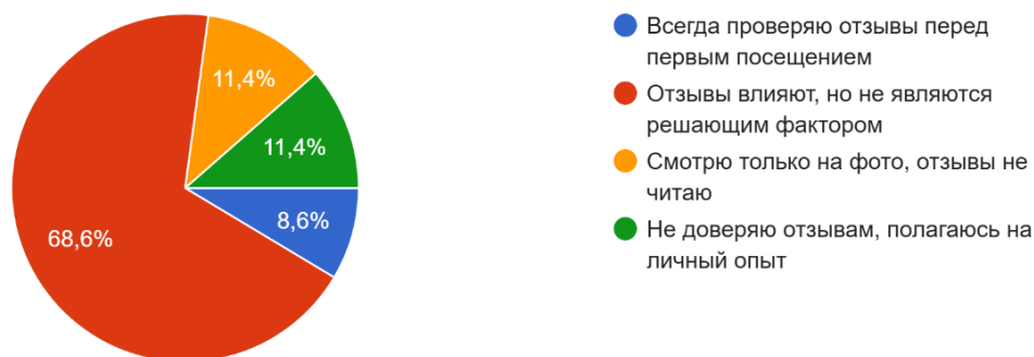
Рисунок 3. – Влияние отзывов на выбор заведения общественного питания