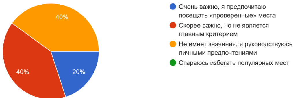
Рисунок 4. – Влияние социологического фактора на выбор заведения общественного питания

Таким образом, эмпирические данные полностью подтверждают теоретические положения. Формирование спроса молодежи г. Новополоцка — это гибридный процесс, в котором рациональная экономическая модель тесно переплетается с социологической и психологической моделями. Поведение потребителей укладывается в рамки интуитивно-распознавательной модели, где решение является быстрым, ситуативным и основанным на ограниченном, но социально верифицированном наборе сигналов.