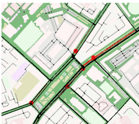
Рисунок 2. – Графическое представление результатов моделирования

Разработан подмодуль графического интерфейса для предоставления результатов моделирования пользователю в простом виде.