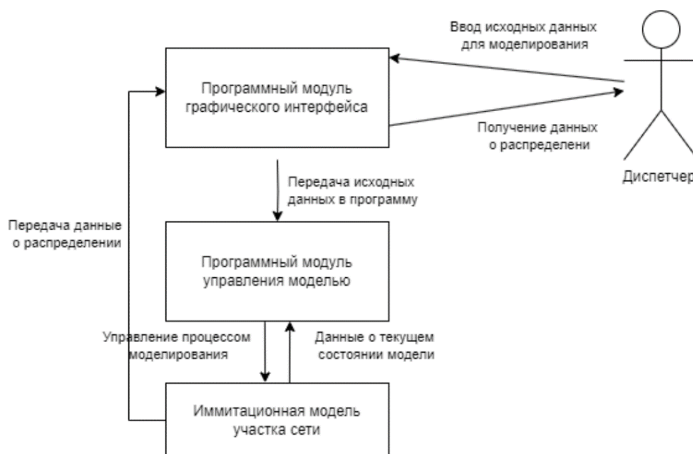
Рисунок 1. – Общая структура программного комплекса

Модуль управления реализует ключевую логику работы комплекса и включает два подмодуля: