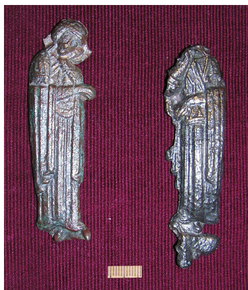
Малюнак 60. Бронзавыя фігуркі Прадстаячай Багародзіцы і апостала Іаана з полацкага гарадзішча, раскопкі Д.У. Дука ў 2007 г.