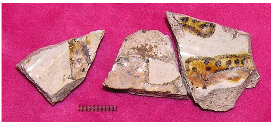
1 – знешні выгляд, 2 – унутраны выгляд