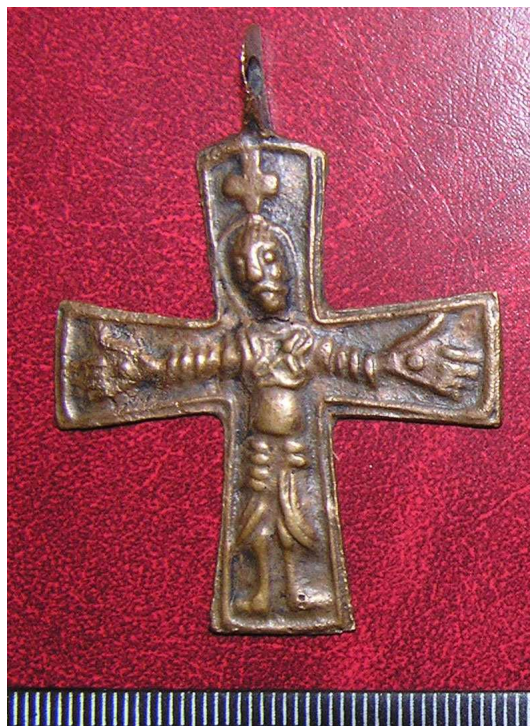
Малюнок 63. Бронзавы нацельны крыж з выявай Ускрыжавання, знаходка А.Г. Бухавецкага