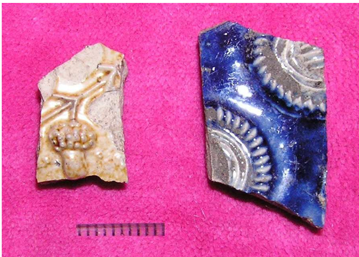
Малюнак 70. Фрагменты рэйнскай (злева) і турэцкай (справа) керамікі, раскопкі Д.У. Дука ў 2002 г.