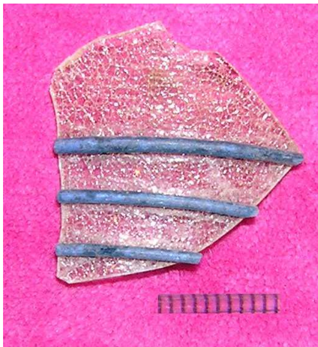
Малюнок 67. Фрагмент шкляного начиння, раскопки Д.У. Дука ў 2002 г.