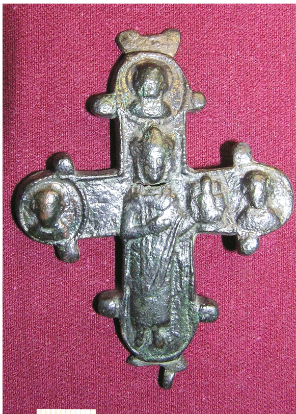
Малюнок 61. Бронзавая адваротная створка крыжа-энкаліпёна з выявай князя Глеба, раскопкі Д.У. Дука ў 2007 г.