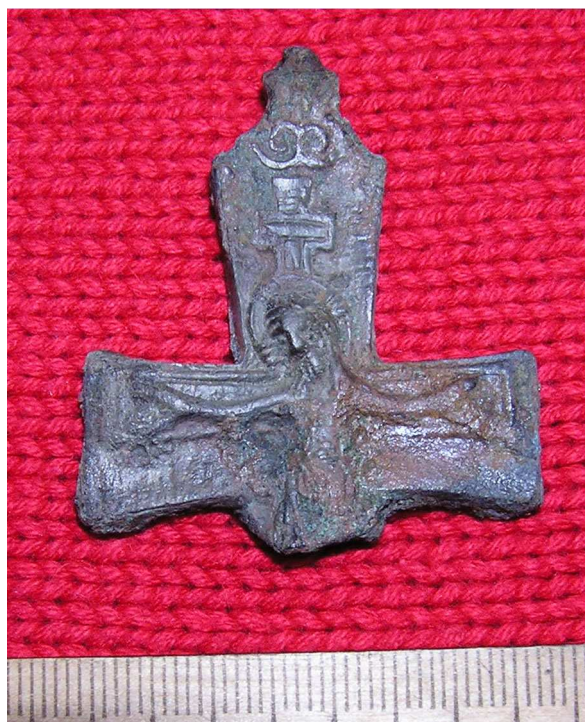
Малюнок 62. Бронзавая ліцавая створка крыжа-энкаліпёна з выявай Ускрыжання, раскопкі Д.У. Дука ў 2009 г.