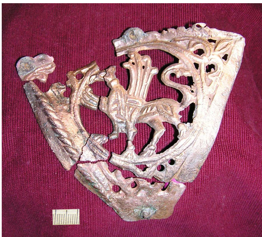
Малюнок 64. Бронзавая накладка на чару з выявай грыфона, раскопкі Д.У. Дука ў 2007 г.