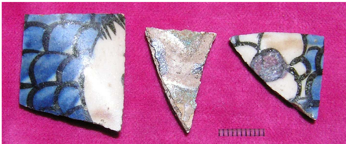
Малюнак 69. Фрагменты рэйнскай керамікі, раскопкі Д.У. Дука ў 2002 г.