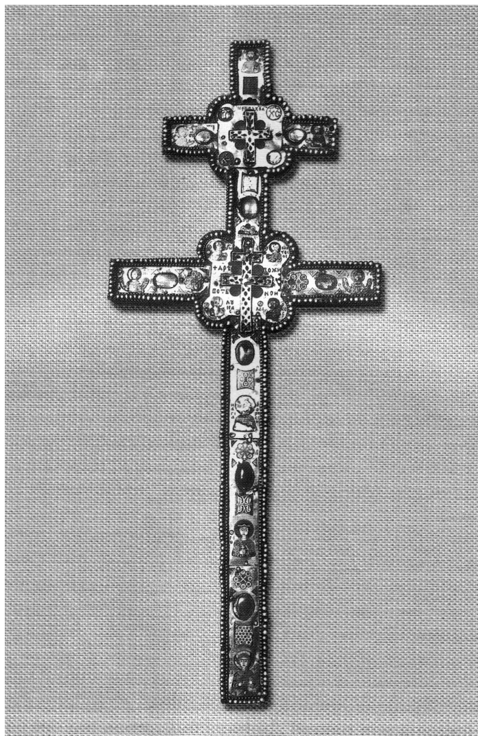
Малюнак 65. Крыж Еўфрасінні Полацкай. Фотаздымак 1896 г.