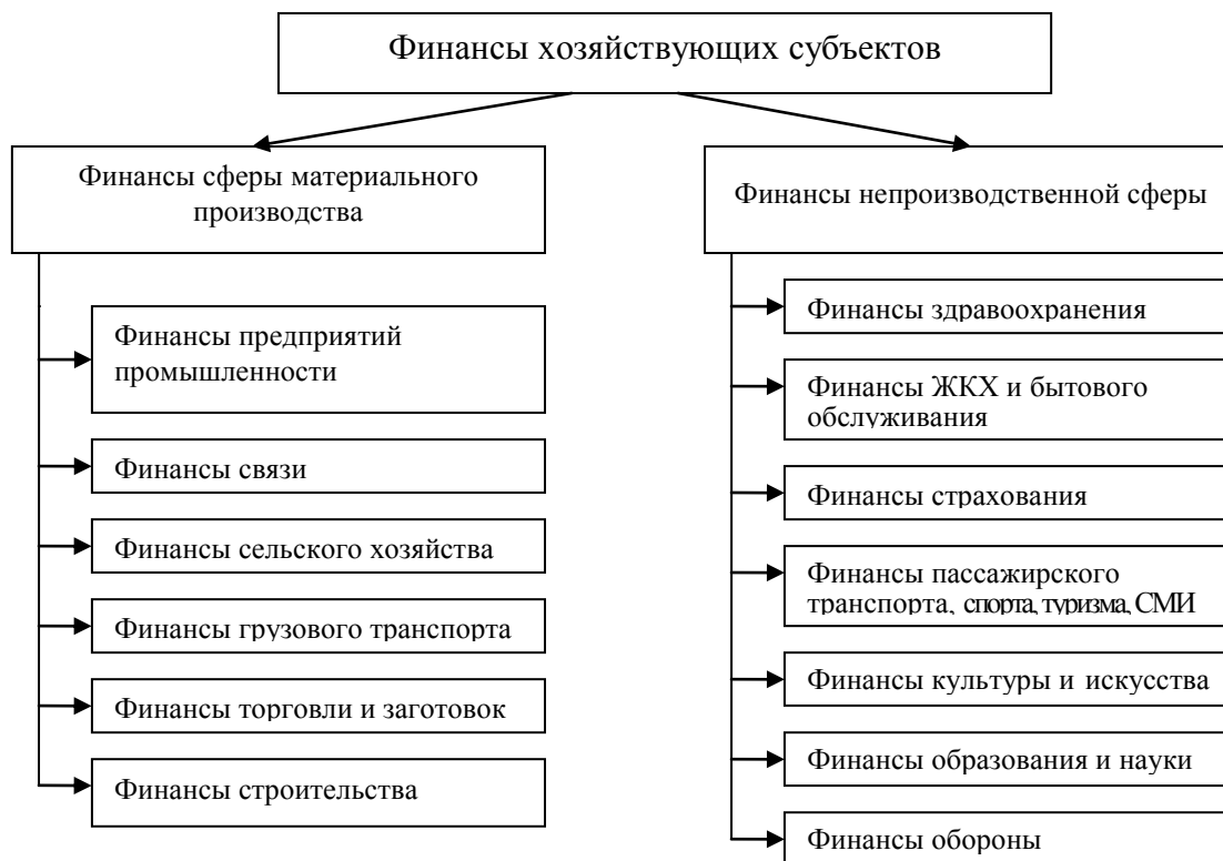
Рис. 2 – Звенья финансов хозяйствующих субъектов

I. Финансы хозяйствующих субъектов и населения (децентрализованные финансы) – это денежные отношения, связанные с формированием и использованием децентрализованного фонда финансовых ресурсов с целью обеспечения своих интересов.