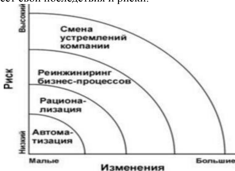
Рисунок 1.7 - Уровни структурных изменений в компании

На рис. 1.7 показаны четыре основных класса структурных изменений в компании, которые поддерживаются информационными технологиями. Каждый из них имеет свои последствия и риски.