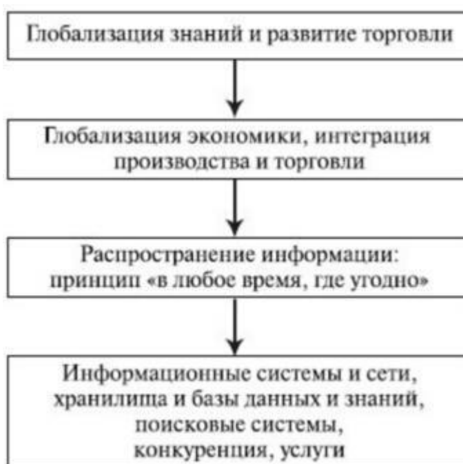
Рисунок 1.5 - Предпосылки развития ИТ

Глобализация и интегрированное развитие индустриальных экономик значительно расширяет возможности бизнеса. Информационные технологии и информационные системы (ИТ/ИС) обеспечивают мобильный доступ и аналитическую мощь, которые удовлетворяют потребности в проведении торговли и руководстве предприятиями в масштабе стран и континентов. Это создает угрозы национальным и региональным фирмам: глобальная связь и системы управления доставляют потребителю информацию о предложениях, качестве и ценах и позволяют совершать сделки и заказы в течение 24 часов в сутки в любом месте, где есть доступ в сеть.