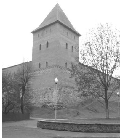
Рис. 6. Северо-восточная башня Лидского замка