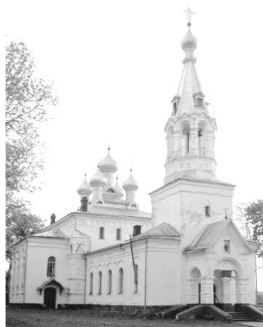
Рис. 7. Собор Святого пророка Ильи в Любче

При посещении вышеперечисленных экскурсионно-развлекательных мероприятий туристы будут проживать в Любчанском замке не менее 6 – 7 дней. Только при такой активной концепции развития замок как туристический центр будет успешно развиваться и иметь перспективу.