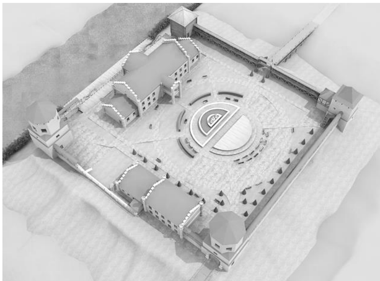
Рис. 4. Вид сверху на замковый комплекс

ходной дорожкой на две функциональные зоны. Первая зона отдыха и частичная реконструкция ранее существовавшей дворовой территории включает в себя фонтан в виде полукруга с малыми архитектурными формами. Вокруг фонтана вдоль прогулочной дорожки установлены скамьи и выполнено озеленение. Вторая зона в виде полностью замощенного бутом полукруга – театрально-зрелищная площадка с установленной напротив фонтана, через дорожку, полукруглой деревянной или каменной сценой. Устройство такой площадки в замке позволит устраивать исторические театрально-зрелищные представления, а также различные культурно-массовые мероприятия и тем самым привлечь в Любчанский замок большее число туристов.