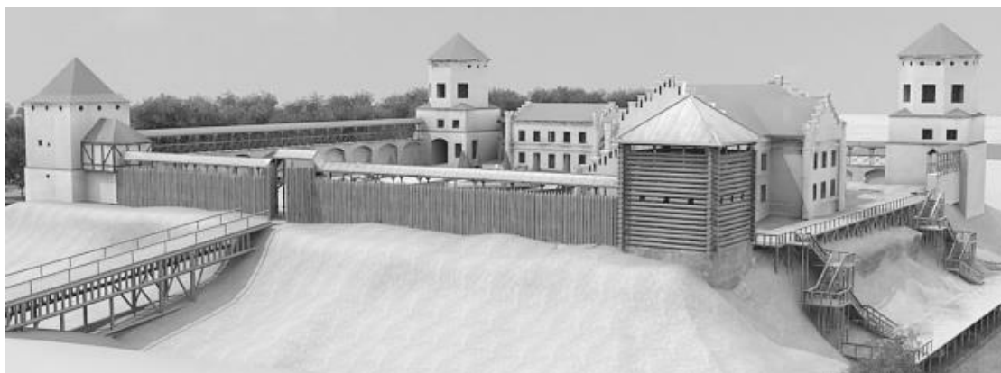
Рис. 2. Вид на замковый комплекс с левого берега реки Неман

Восстановление четвертой башни и крепостной стены до южной башни внесет законченность в целостный образ замкового комплекса (рис. 2). Существует предположение, что четвертая башня была возведена из бревен [2]. Первоначально необходимо будет восстановить несохранившийся бутовый фундамент башни. Предлагается сруб башни выполнить в три яруса, с устройством бойниц на двух нижних и смотровой площадки на третьем ярусе. Крышу башни выполнить из гонта. Замковую стену между деревянной и южной башней возвести из частокола с устройством на ней галереи. В этой же стене в соответствии с описаниями выполнить вторые въездные ворота в замок и воссоздать существовавший ранее деревянный мост через ров.