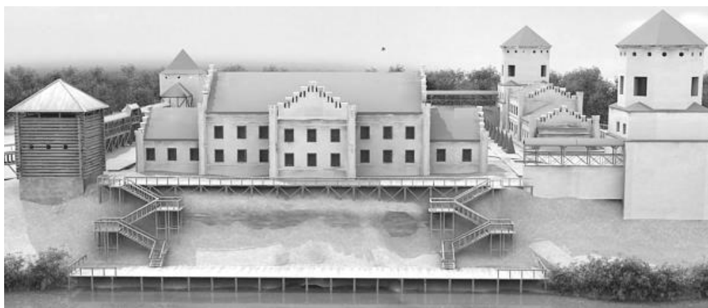
Рис. 3. Вид на замковый комплекс с правого берега реки Неман

В башне-браме необходимо восстановить деревянные въездные ворота. Со стороны главного въезда через башню-браму вместо насыпи через ров также возвести деревянный мост. Кроме того дополнительную выразительность замку могут внести восстановленные часы, располагавшиеся, согласно одному из inventарей, в стене над въездными воротами башни-брамы [3]. Вдоль фасада дворца со стороны реки восстановить прогулочную площадку из деревянного бруса с дощатым настилом и выполнить лестничные спуски с устройством промежуточных смотровых площадок к реконструируемой деревянной пристани (рис. 3). Работы по воссозданию площадок и лестниц существенно сократятся по времени, так как сохранилась подпорная береговая стена из бута вдоль дворца. Устройство пристани позволит устраивать речные прогулки по Неману на катерах для ознакомления с окружающими местными пейзажами, включая и Налибокскую пушу.