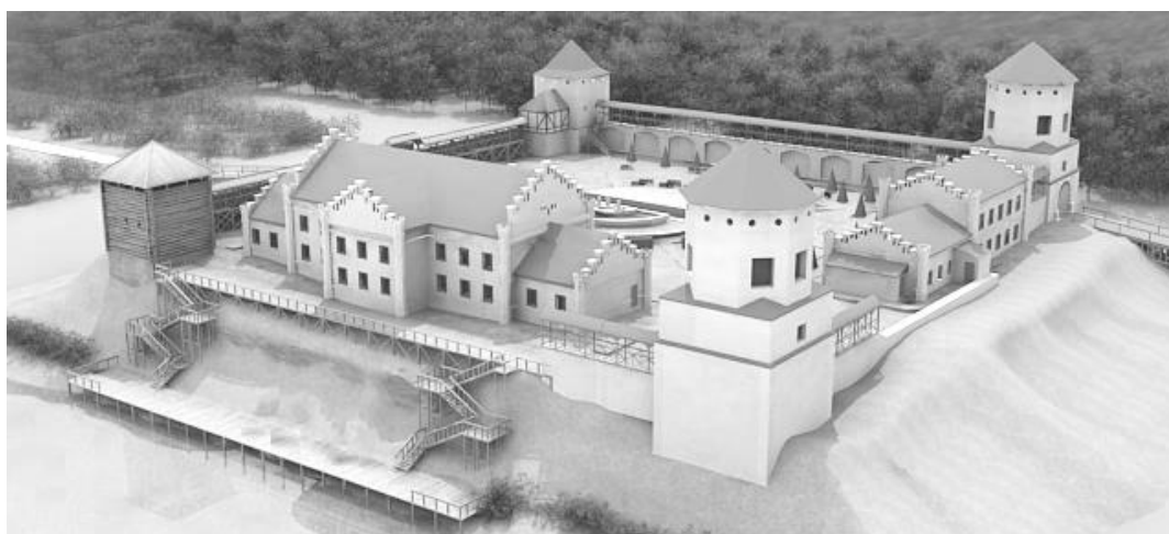
Рис. 1. Вид на замковый комплекс с высоты птичьего полета

На основании существующих фотографий, выполненных обмерочных работ и разработанных чертежей башни-брамы, южной башни, флигеля, жилой пристройки и учебного корпуса с помощью компьютерной программы для 3D моделирования «3Ds MAX» произведено пространственное моделирование реконструкции Любчанского замкового комплекса (рис. 1 – 4). Основной целью выполненного пространственного моделирования является восстановление территории замка с учетом разных этапов его существования.