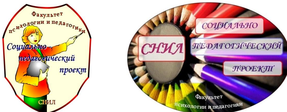
Рис. 2. Герб и эмблема СНИЛ «Социально-педагогический проект»

всех участников лаборатории в перспективное планирование, мотивировать студенческую активность в научно-исследовательской и других видах социально значимой деятельности.