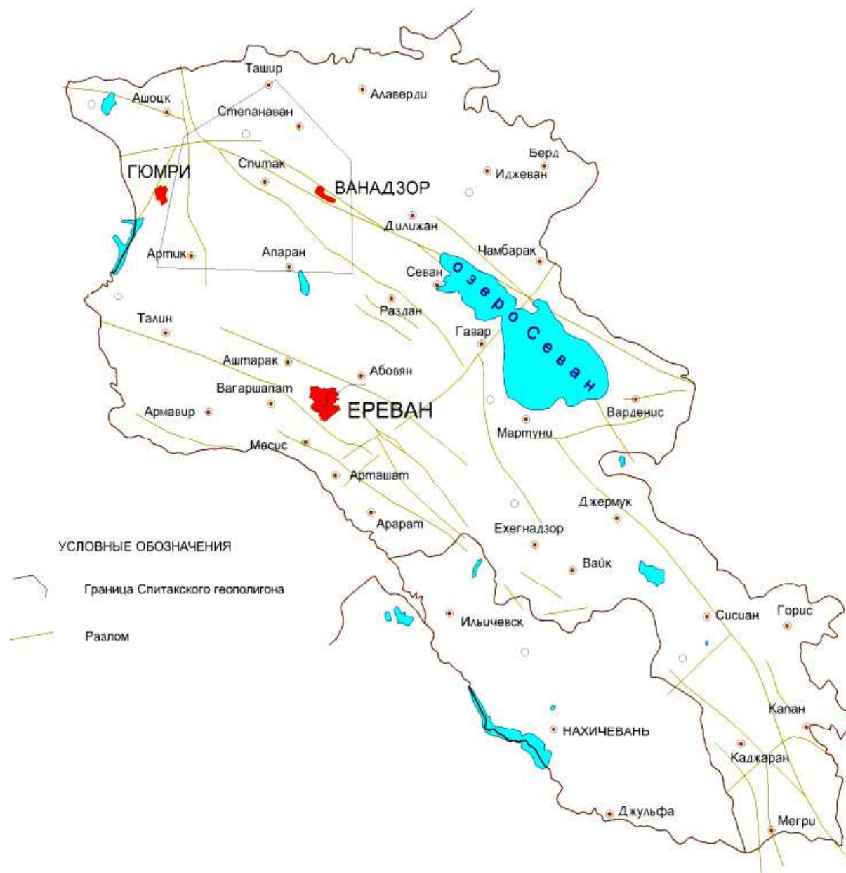
Рис. 1. Схема расположения Спитакского геодинамического полигона

ских реперов. В самом эпицентре расположено Арпиличское водохранилище на высоте более 2000 м протяженностью 700 м. Водоохранилище находится между городом Гюмри (Ленинакан) и городом Ахалкалаки. Вдоль автомобильной дороги между этими городами на протяжении 90 км были заложены реперы разной конструкции для исследований причин столь значительных движений земной коры [2].