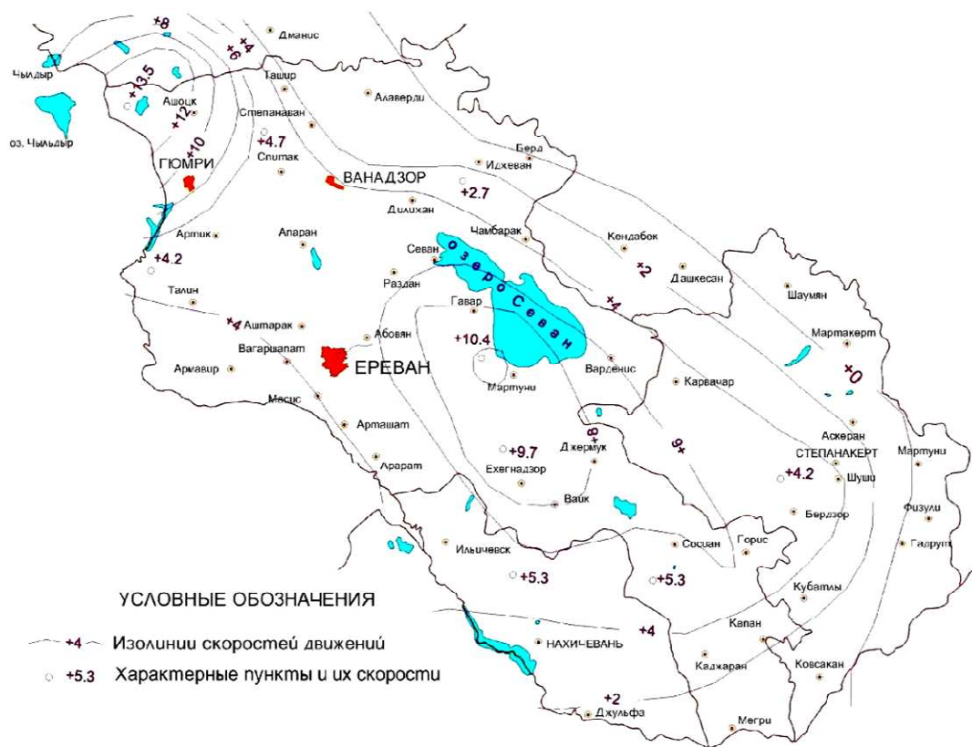
Рис. 2. Карта современных движений земной коры по результатам геодезических измерений

исследования динамических движений земной коры. Впервые в Армянской Республике реконструкция Главной высотной основы успешно осуществилась с применением новых цифровых технологий.