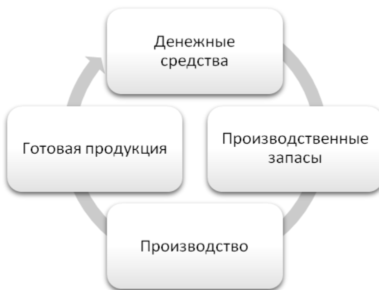
Рис. 2.3. Кругооборот оборотных средств предприятия

Совершая полный кругооборот ( D-T \dots P \dots T_1-D_1 ), оборотные средства функционируют на всех стадиях одновременно, что обеспечивает непрерывность процессов производства и обращения. К концу кругооборота оборотные средства будут в том же объеме, что и в начале кругооборота. Размеры первоначальной суммы денег ( D ) и выручки ( D_1 ) от реализации продукции, работ, услуг не совпадают по величине. Причины несовпадения заключаются в финансовом результате бизнеса - прибыли или убытке.