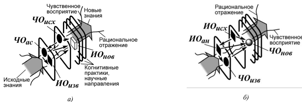
Рис. 2. Механизм творческой концептуальной (а) и эйдетической (б) интуиции в процессе формирования знаний

Другой механизм интуитивного мышления – творческая эйдетическая интуиция – это способ формирования наглядных представлений об объекте, который по каким-либо причинам недоступен для непосредственного наблюдения, хотя его информационный образ ИО_{исх} исследователю известен. Механизм взаимодействия информационных и чувственных образов при реализации акта творческой эйдетической интуиции схематически представлен на рисунке 2, б. Процесс познания в данном случае заключается в том, что на основе исходного информационного образа происходит интуитивный поиск сведений ИО_{ан} об объекте, представляющем собой аналог изучаемого явления, и для которого имеется четкий чувственный образ ЧО_{изв} . На основе данного чувственного образа и с учетом информации об изучаемом объекте у исследователя создается наглядное представление об исследуемом явлении. Таким образом, новый чувственный образ ЧО_{нов} интуитивно возникает как продукт взаимодействия первоначального информационного образа изучаемого объекта, аналога этого образа и наглядного представления об аналогичном объекте.